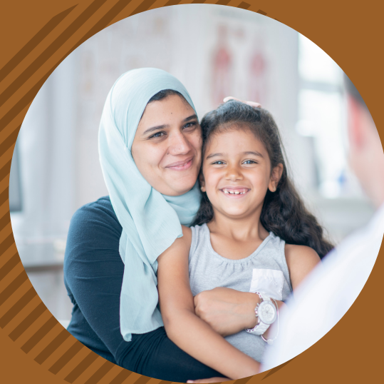
Accès, coordination, optimisation des services