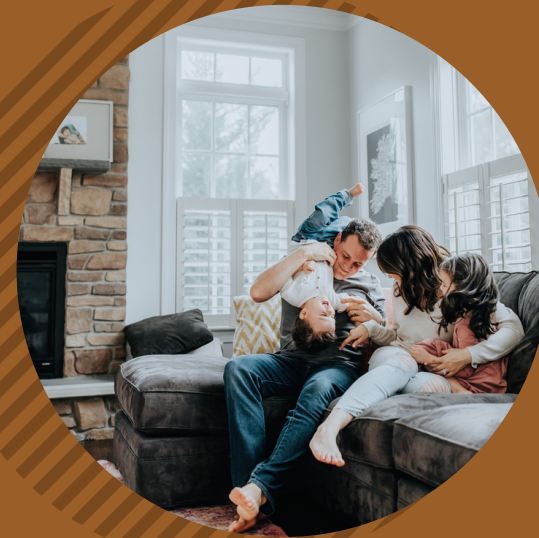
Accès au logement