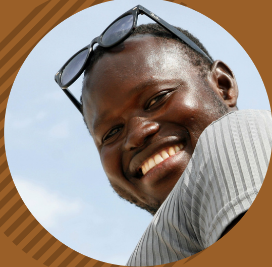
Intégration économique et l'employabilité