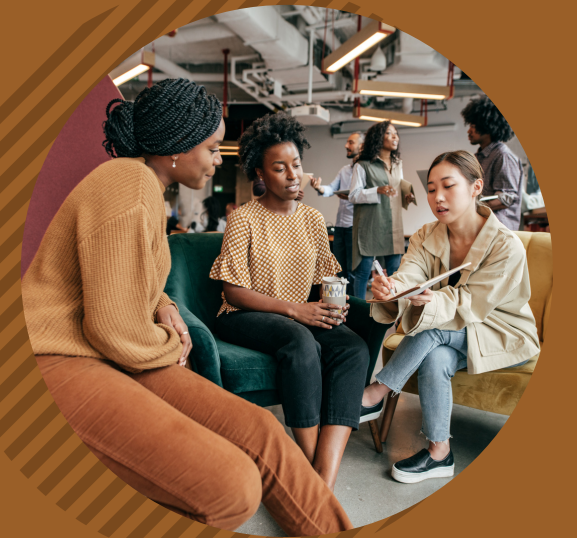
Appui aux personnes à statut précaire d'immigration