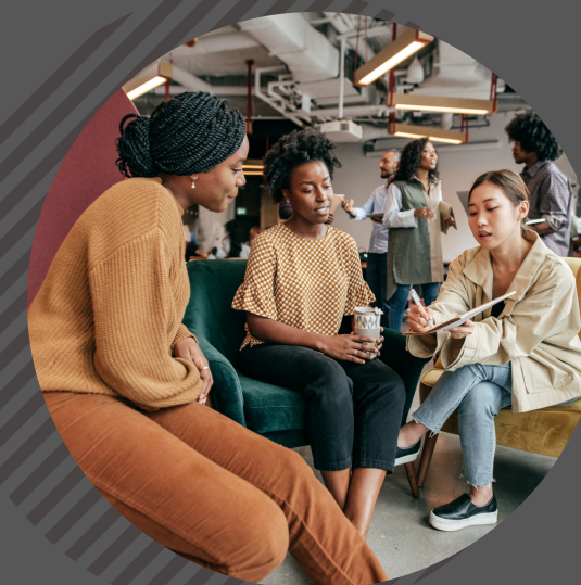
Appui aux personnes à statut précaire d'immigration