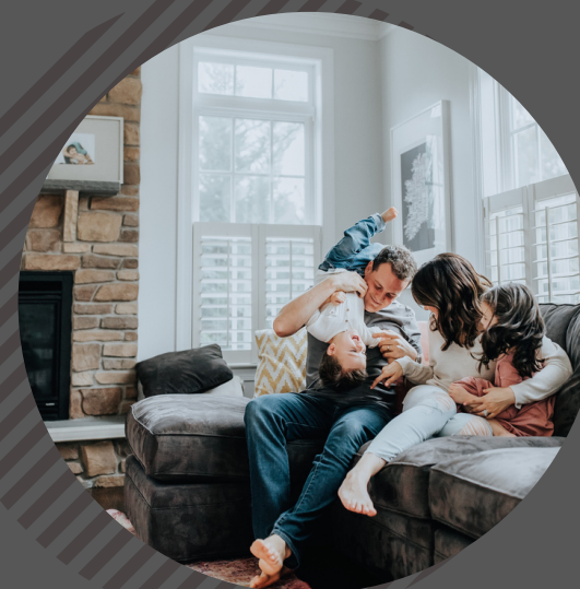
Accès au logement