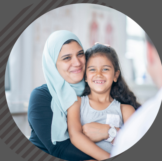
Accès, coordination, optimisation des services