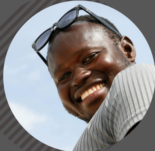
Intégration économique et l'employabilité