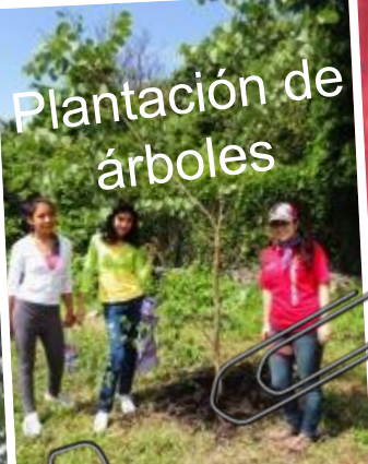
Plantación de árboles