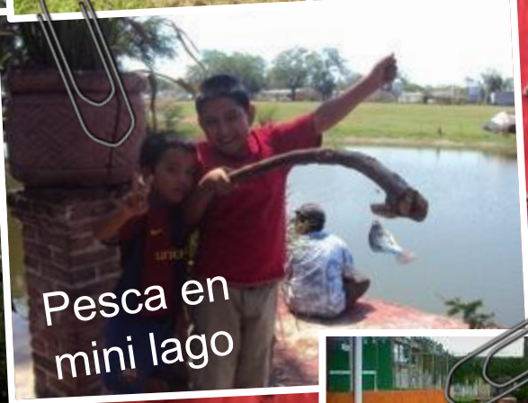
Pesca en mini lago