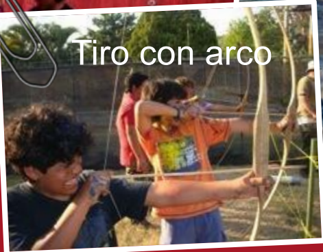
Tiro con arco