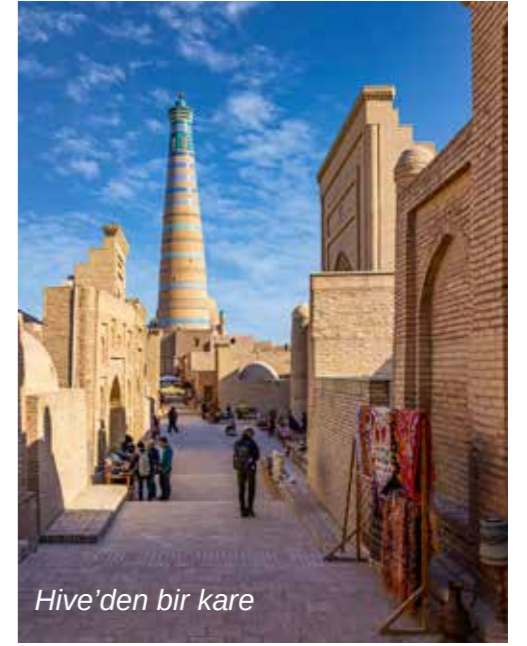
Hive'den bir kare

Uluğ Bey döneminde şehir dünyanın ilmî merkezi haline geldi. Semerkant'ta en gözde matematik ve astronomi bilginlerinin okullarında araştırmalar yapılıyordu. 1428 yılında yapımı tamamlanan Uluğ Bey Rasathanesi, döneminde dünyada benzeri bulunmayan bir ilim merkeziydi. Semerkant'ta Tarihî Siyab Pazarı, Şahi Zinde (Yaşayan Şah), Bîbî Hanım Camii, Gûri Emir, Registan Meydanı, Semerkant Rasathânesi gibi dünya kültür varlığı niteliğinde sayısız tarihi eser bulunuyor. Ayrıca İmam Maturidi Türbesi, İmam Buhari Külliyesi gibi Türk ve İslam dünyası için manevi değeri son derece yüksek önemli inanç merkezleri de burada yer alıyor.