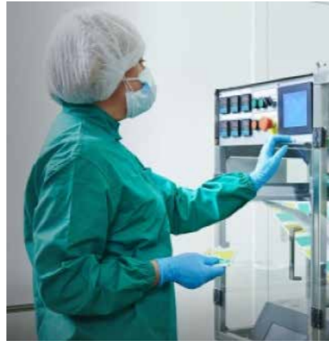
"Parkent-Pharm" (Taşkent) ilaç üretim ihtisas bölgesinden bir kare.

EİZ bölgelerinde üretim yapmak ve teşviklerden faydalanmak isteyen yatırımcı belirlenen prosedüre göre öncelikle ilgili bölgenin Müdürlüğü'ne başvuru yapıyor. EİZ Müdürlüğü başvuruyu 2 iş günü içinde değerlendiriyor ve herhangi bir eksiklik olmaması halinde incelenmek üzere "Projeler ve İthalat Sözleşmeleri Kapsamında Uzmanlık Merkezi"ne gönderiyor. Merkez başvuruyu ve iş planını 20 iş günü içinde inceleyerek Serbest Ekonomik Bölgeler ve Özel Ekonomik Bölgeler Yönetim Kurulu'na sunuyor. Yönetim Kurulu da 5 gün içinde yatırım projesinin uygunluğu konusunda karar verir. Yatırım projesinin uygulanmasına ilişkin karar alındıktan sonra 1 iş günü içerisinde Serbest Ekonomik Bölgeler ve Küçük Sanayi