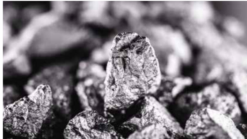
Gümüş madenleri açısından ülke Dünya sıralamasında dokuzuncu yeredir.