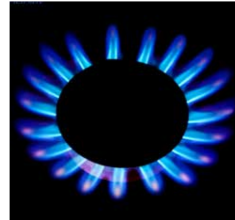
Ülkenin doğal gaz rezervleri de Dünya çapında on altıncı sıradadır.