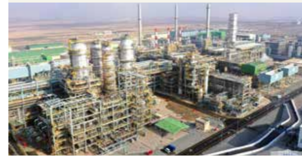
Özbekistan'ın Kaşkadarya ilinde bulunan "Uzbekistan GTL" sentetik sıvı yakıt üretim fabrikası.