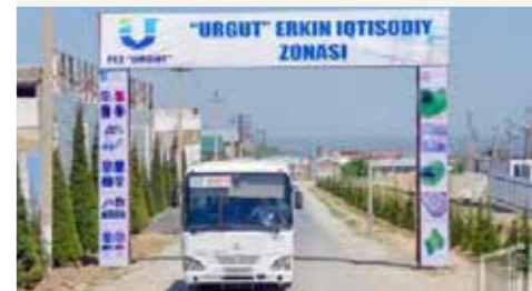
Semerkant'taki Ürgüt EİZ'den bir kare.

EİZ'lerdeki parseller açık artırma yoluyla edinilmektedir.