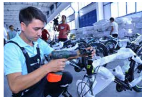
Kokand EİZ'deki bisiklet üretim işletmesinden bir kare.