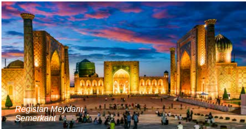
Registan Meydanı, Semerkant

2001 yılında UNESCO Dünya Miras Listesine dahil olan Semerkant seyyahların cennete benzettikleri bir mevkide bulunuyor. Yıllar boyunca kervanların kavşak noktası, Çin ile Avrupa'yı bağlayan Büyük İpek Yolu'ndaki en önemli merkez olan şehir, İranlılar, Yunanlar, Çinliler, Türkler, Araplar ve Moğolların yönetimi altında bulunmuş, 14. yüzyılda Büyük Timur'un devletine başkentlik yapmış. Timur'un torunu Mirza