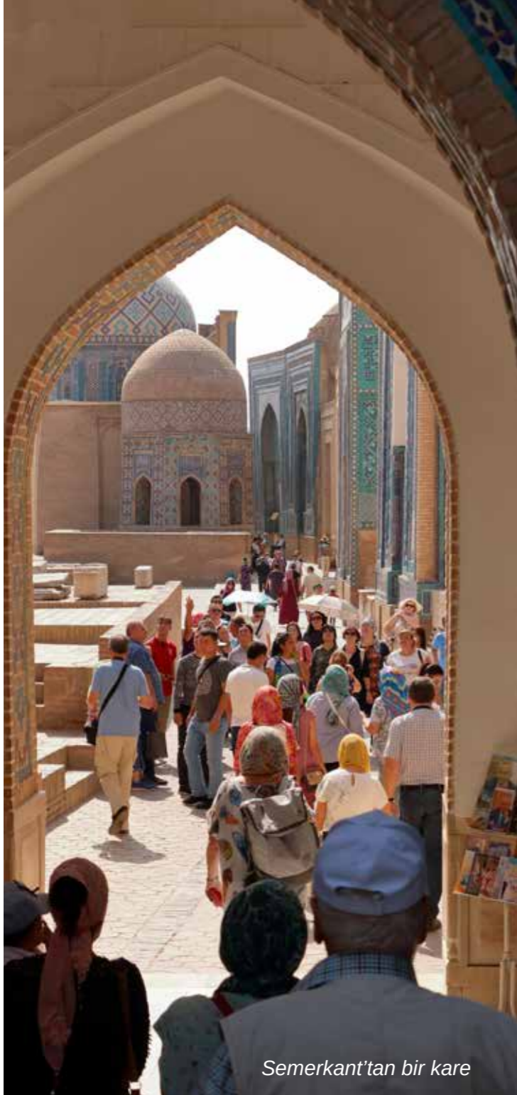
Semerkant'tan bir kare

Kendi bölgesinde en çok nüfusa sahip oluşu, elverişli coğrafi konumu ve büyük pazarlara yakınlığı, Özbekistan'ı yabancı yatırımcılar için çok daha çekici hale getirmektedir. Özbekistan kuzeyden güneye, doğudan batıya geçen transit koridorların doğal kavşağında yer almaktadır. Orta Asya'nın tam merkezinde yer alan Özbekistan Cumhuriyeti, batıda ve kuzeyde Kazakistan, güneyde Afganistan, güneybatıda Türkmenistan, doğuda Kırgızistan, güneydoğuda da Tacikistan ile komşudur. Özbekistan Cumhuriyeti'nin sınırları içerisinde Karakalpakistan Özerk Cumhuriyeti yer alır. Özbekistan Cumhuriyeti'nin yüzölçümü 447.400 kilometrekaredir.