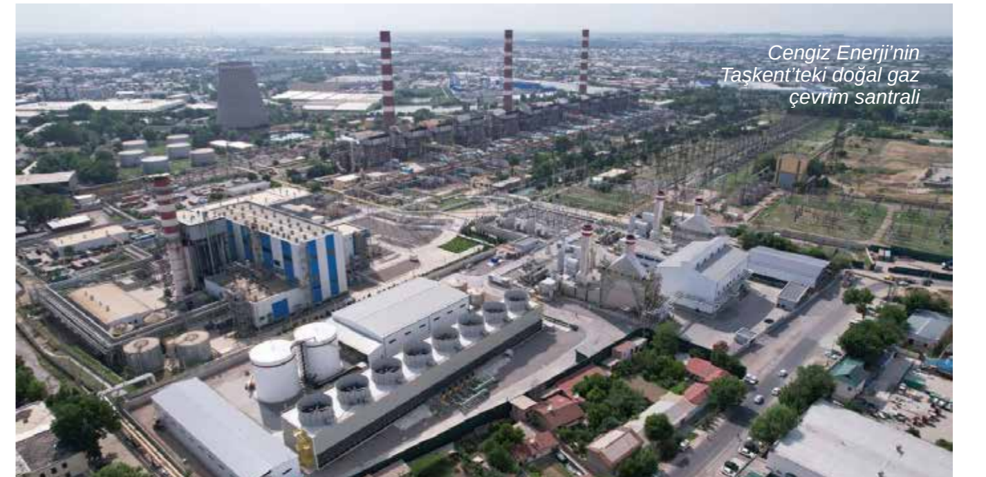
Cengiz Enerji'nin Taşkent'teki doğal gaz çevrim santrali

yatırımlara imza atıyoruz. Dış ticaret hacmi 50 milyar doları aşan Özbekistan ile en çok ticaret yapan 5 ülkeden biri konumundayız. Özbekistan Cumhurbaşkanı Sayın Shavkat Mirziyoyev liderliğinde uygulamaya konan ve Türk yatırımcılar için yeni fırsatlar sunan kapsamlı reform programını destekliyoruz. Türk iş dünyası için birçok alanda yatırımlara önderlik eden Özbekistan'da önümüzdeki dönemde de yeni yatırım fırsatlarını değerlendirmeye devam edeceğiz.