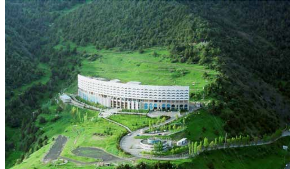
Cizzah ilindeki Zamin Turizm-Rekreasyon ihtisas bölgesinden bir kare.

Tıbbi bitki hammaddelerinin işlenmesi, ilaç, tıbbi ürün, tıp sektöründeki yardımcı ve ambalaj malzemelerinin üretimi, yerel şifalı bitki hammadde ve malzemelerine dayalı farmasötik ürünlerin üretiminin artırılması, ilaç sanayinde ithal ürünlerin ikame edilmesi ilaç üretim ihtisas bölgelerinin kurulmasındaki ana hedefler olarak belirlenmiş bulunuyor.