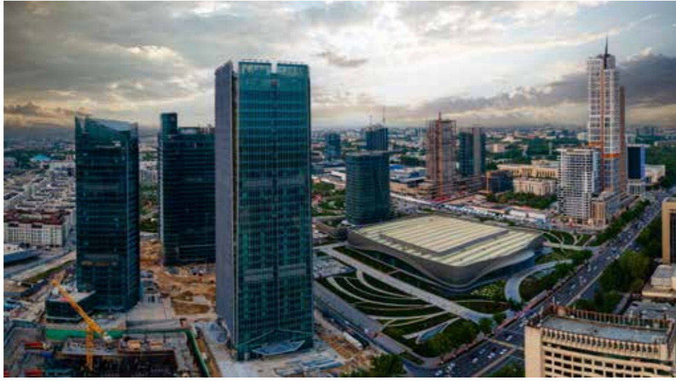
Özbekistan'ın başkenti Tashkent'in merkezinde yeni inşa edilen Tashkent City iş ve ticaret merkezi.

Özbekistan'ın ayırt edici özelliği, siyasi ve makroekonomik istikrara sahip olmasıdır. Özbekistan, bağımsızlığına kavuştuğu tarihten bu yana geçen 32 yılda, ciddi bir kriz veya siyasi huzursuzluktan etkilenmemiştir. Temmuz 2023'da düzenlenen seçimlerin demokratik ve şeffaf bir şekilde sonuçlanması, istikrarın ve ülke yönetiminin demokratik değerler ve ilkelere bağlılığının bir göstergesidir.