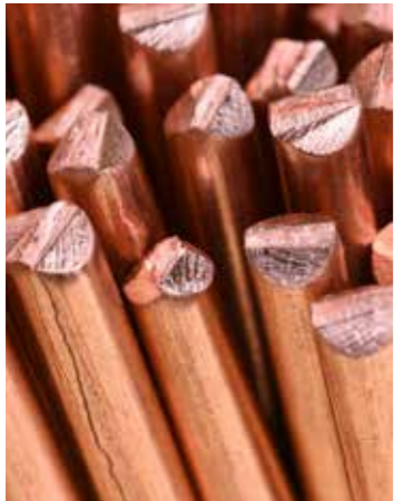
Ülke bakır yatakları açısından Dünya'da yedinci sıradadır.

Özbekistan maden rezervlerinin zenginliği açısından genel olarak dünyadaki 20 ülke arasında yer alıyor.