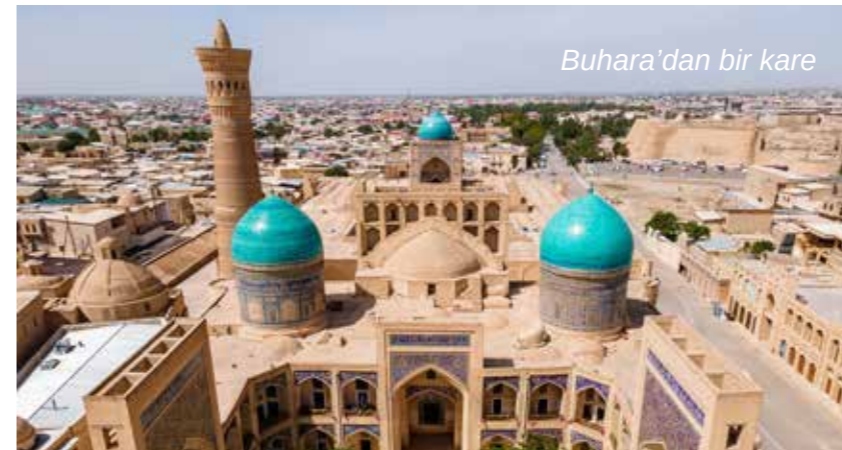
Buhara'dan bir kare

Orta Asya'nın en eski şehirlerinden biri olan kadim Buhara adeta tarihi yapılarla süslenen bir mücevherat şehri olarak biliniyor. Buradaki her bina, sokak ve hatta her kerpiç adeta tarihin hikayelerini anlatıyor. Buhara'dayken insan büyükşehirlerin gürültüsünü unutup, binlerce yıl önceki tarihi döneme seyahat ediyor. 140'ı aşkın tarihi yapı bulunan Şehrin merkez kısmı da UNESCO'nun Dünya Miras Listesine dahil edilmiş bulunuyor. Kelân Kulesi, İsmail Samani Türbesi, Miri Arap Medresesi, Kelân Camii Buhara'daki tarihi mirasın başlıcaları. "Buharalı Yedi Mürşid" olarak adlandırılan Abdülhâlik Gucdüvânî, Ârif Rivgeri, Mahmûd Fağnevî, Ali Râmitenî, Muhammed Baba Semmasî, Emir Külal ve Hazret Bahauddin Nakşibend'e ait ziyaret yerleri bu şehirdedir.