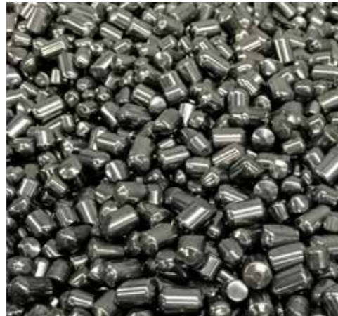
Ülke en büyük sekizinci tungsten kaynaklarına sahiptir.