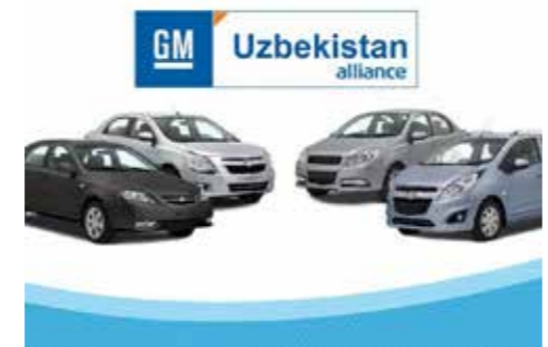
Özbekistan'ın Andican ilinde üretilen GM Uzbekistan binek araçları.

Ekonomik büyüme hedefleri doğrultusunda yeni proje önerilerinin geliştirilmesi ve yatırımcılara sunulması konusuna da özen gösteriliyor.