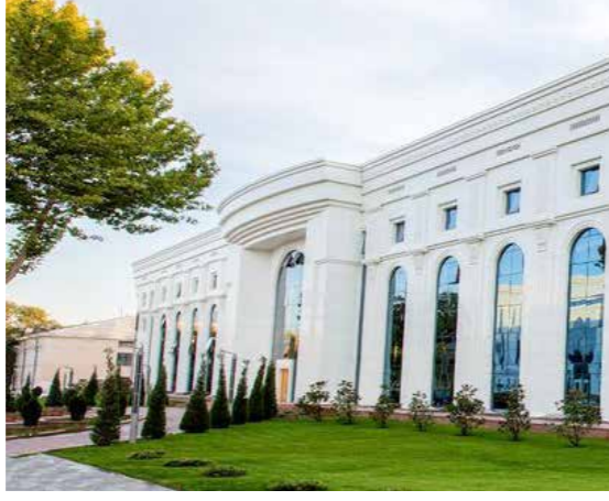
Dışişleri Bakanlığı (www.mfa.uz)