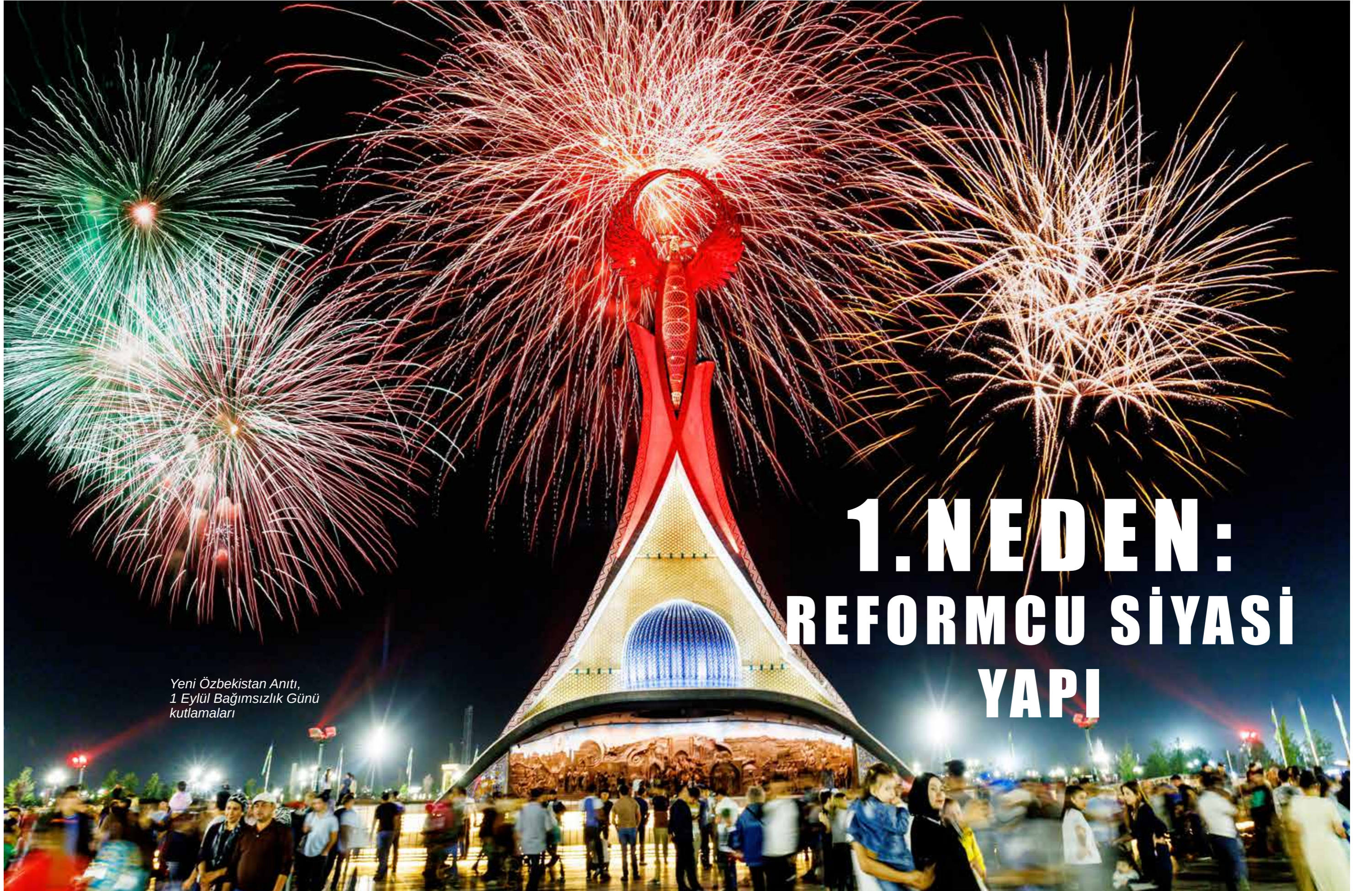
Yeni Özbekistan Anıtı, 1 Eylül Bağımsızlık Günü kutlamaları