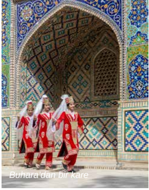
Buhara'dan bir kare