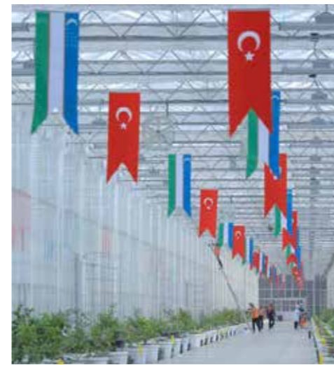
Buhara Agro EİZ'deki bir Türk sermayeli sera işletmesinden bir kare.

Öte yandan ülkede tarım alanında ihtisaslaşmış üretim bölgeleri de bulunuyor. Bu alanda halihazırda Buhara Agro ve Karakalpak Agro gibi iki bölge faaliyetlerini sürdürüyor.