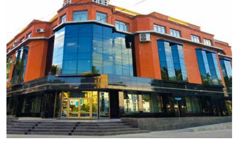
Yatırım Teşvik Ajansı (invest.gov.uz)