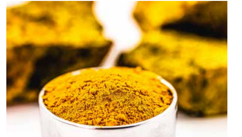
Stratejik öneme sahip uranyum kaynakları bakımından ülke Dünya'da on ikinci sırada yer almaktadır.