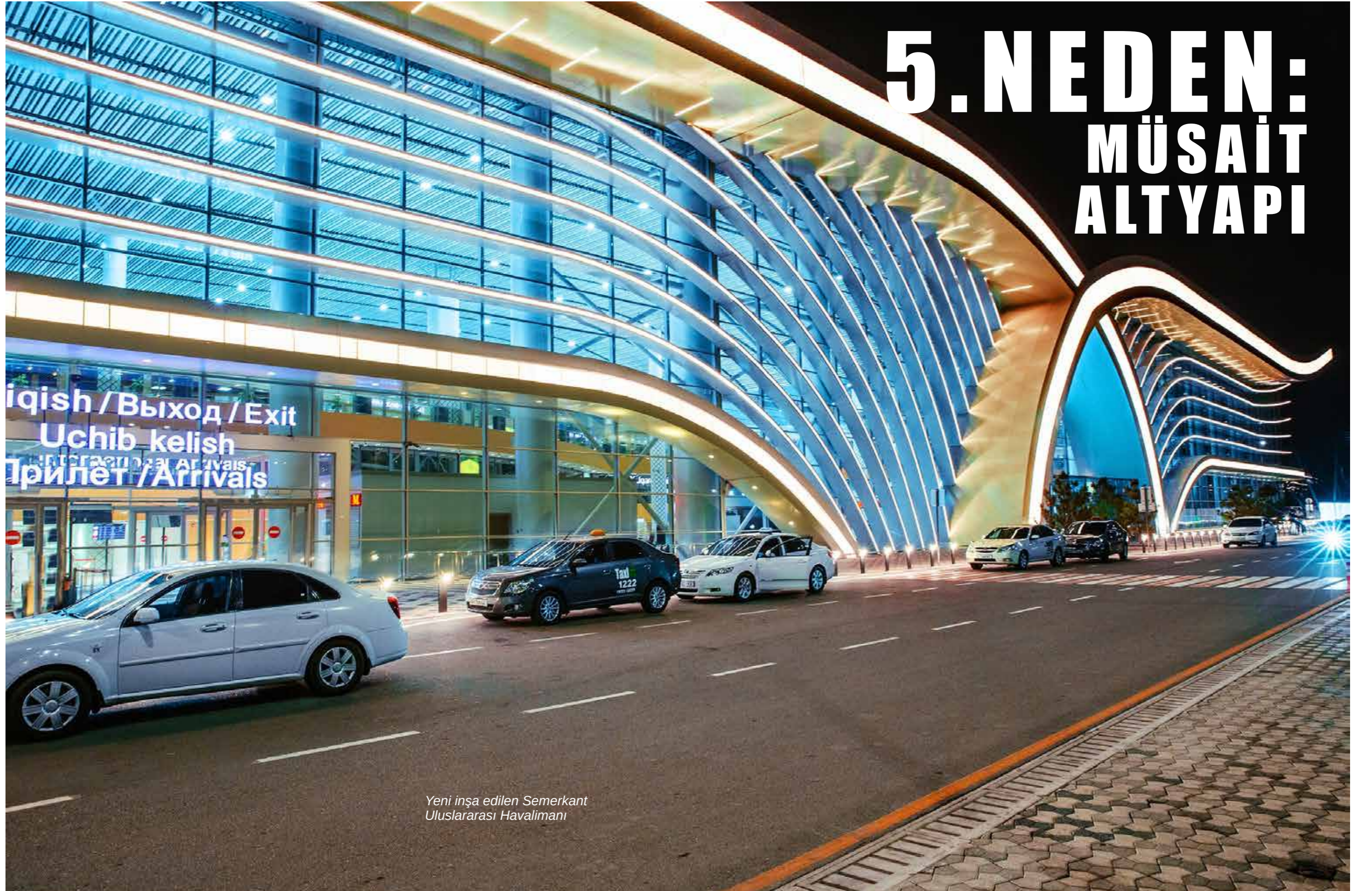
Yeni inşa edilen Semerkant Uluslararası Havalimanı