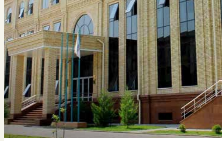
Ticaret ve Sanayi Odası (www.chamber.uz)