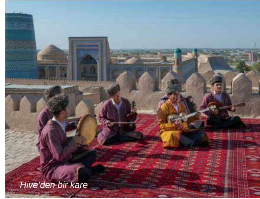
Hive'den bir kare