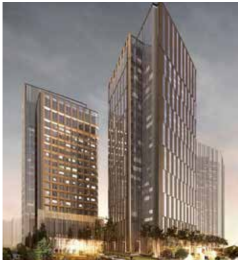
Tashkent'in merkezinde yeni inşa edilen Trilliant yaşam ve iş merkezi.

2022 yılının ülkede dış ticaret cirosu 50.008 milyar dolar olarak gerçekleşmiş, 2021 yılına göre 7,8 milyar dolar yani %18,6 artış gözlemlenmiştir. Aynı dönemde ihracat hacmi yüzde 15,9 artışla 19,3 milyar dolara, ithalat ise yüzde 20,4 artışla 30,7 milyar dolara ulaşmıştır.