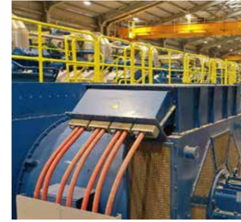
Cengiz Enerji'nin Tashkent ilindeki doğalgaz kombine çevrim santralinden bir kare