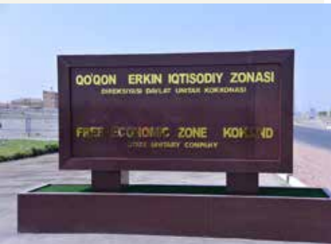
Kokand EİZ tabelası.