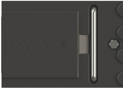
Manija para elevación de la tapa y perno "L" con cabeza hexagonal.