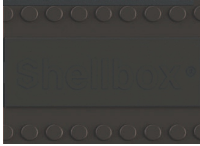
Área de personalización con logo.