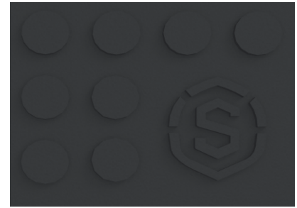
Garantía de resistencia.