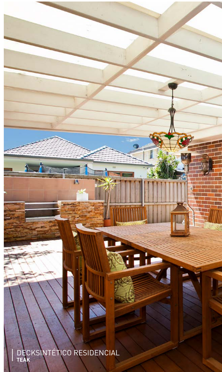
DECKSINTÉTICO RESIDENCIAL TEAK