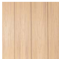
MAPLE TDCE22.5-R-MAPLE/ LIGHT GRAY