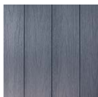
SILVER GRAY TDCE22.5- SILVER GRAY/LIGHT GRAY