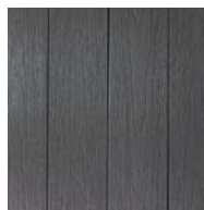
LIGHT GRAY TDCE22.5- LIGHT GRAY/SILVER GRAY