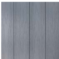
LIGHT GRAY TDCE22.5-R- LIGHT GRAY/MAPLE