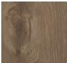
Luxury Collection #5998 Daple Oak