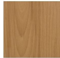
Imperial Collection #1008 Cherry Beach

Categorías: Imperial 8mm biselado, Imperial Collection, Piso Laminado, SuperFloor