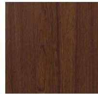
Imperial Collection #1041 Great Jatoba