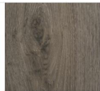
Imperial Collection #1605 Encore Grey