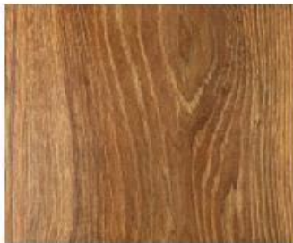
Grand Collection 7mm #8352 Wild Oak