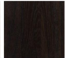
Imperial Collection #1251 Wenge Mood