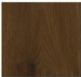
Luxury Collection #9955 Rosel Oak