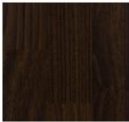
Luxury Collection #7469 Wenge Strip