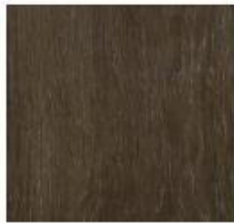
Luxury Collection #5500 Cinamon Grey