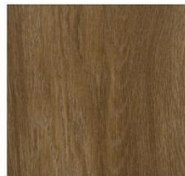
Imperial Collection #3060 Harvest Oak