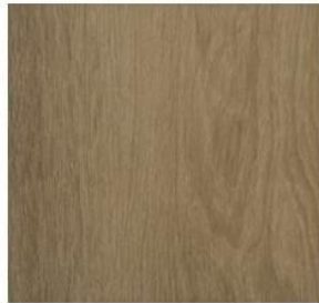
Wide Collection #8112 Suede Oak