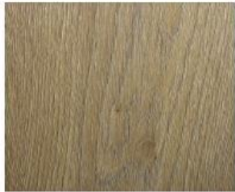
Grand Collection 7mm #8097 Paso Oak