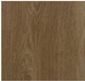
Wide Collection #8113 Taupe Oak