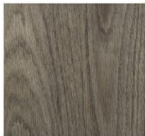
Imperial Collection #3047 Just Grey