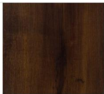
Imperial Collection #1280 Rustic Mahogany