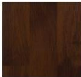
Luxury Collection #7109 Best Jatoba