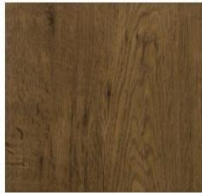
Wide Collection #9535 Rustic House