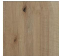
Imperial Collection #6162 Cream Oak