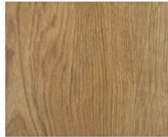
Grand Collection 7mm #5985 Sherwood Oak