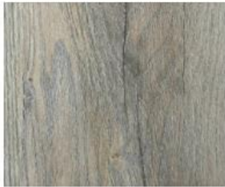
Grand Collection 7mm #4295 Lake Oak