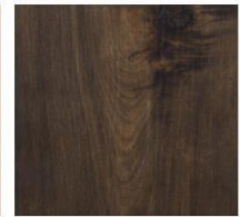
Imperial Collection #1200 Walnut Rustic