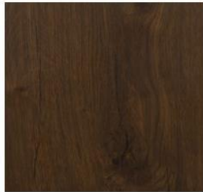
Wide Collection #7376 Spice Oak