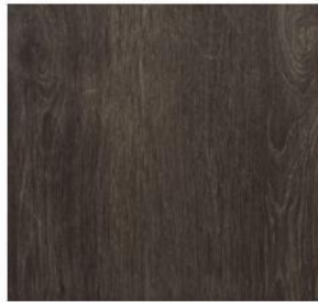
Wide Collection #8115 Dolphin Oak