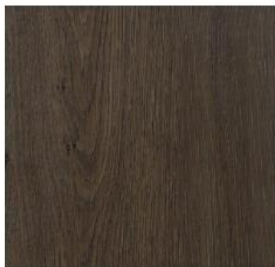
Wide Collection #9550 Rustic Place