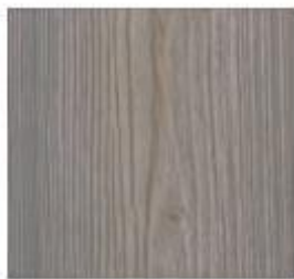
Luxury Collection #1805 Oak Grey