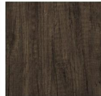
Imperial Collection #1240 Old Oak