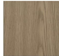
Imperial Collection #1204 Oak Film