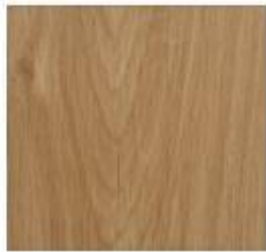
Luxury Collection #4911 Raw Oak