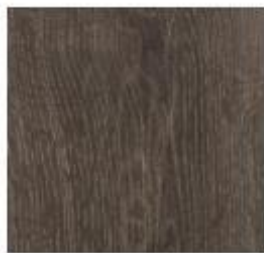
Luxury Collection #1989 Rocky Grey