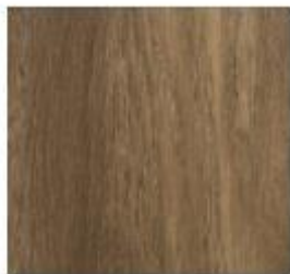
Luxury Collection #6010 Sierra Oak