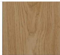
Imperial Collection #1336 Oak Time