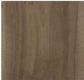
Wide Collection #2009 Native Oak