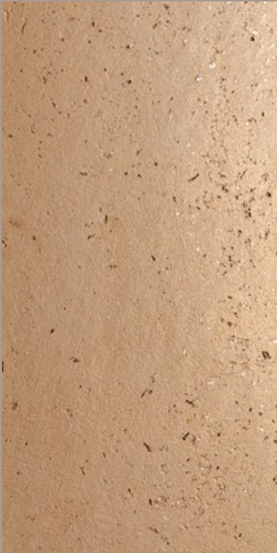
TEODORICO TDB 15678 + CERA BRONZE (diluizione / dilution 1:1)