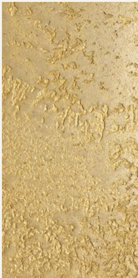
MARMUR FINE 15047 + CERA BAROCCO GOLD

Le tonalità qui riprodotte, pur avvicinandosi a quelle di fornitura, sono indicative. Per una corretta lettura dei colori si raccomanda di consultare questa cartella alla luce solare.