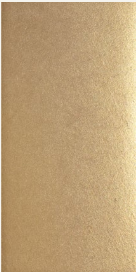
MARMORINO KS 15115 + CERA GOLD