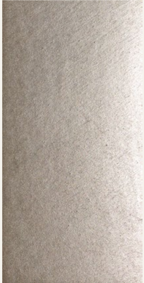
MARMORINO KS 15115 + CERA SILVER