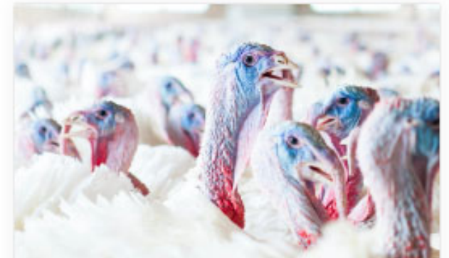
Babillard éleveurs de dindons

Pour mettre une annonce, il suffit de contacter, par téléphone ou par courriel, le personnel des opérations.