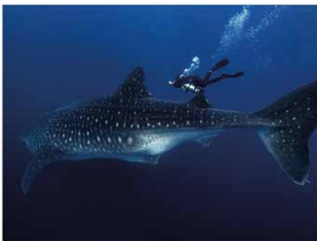
Wolf Island, Galapagos - Junio 2019