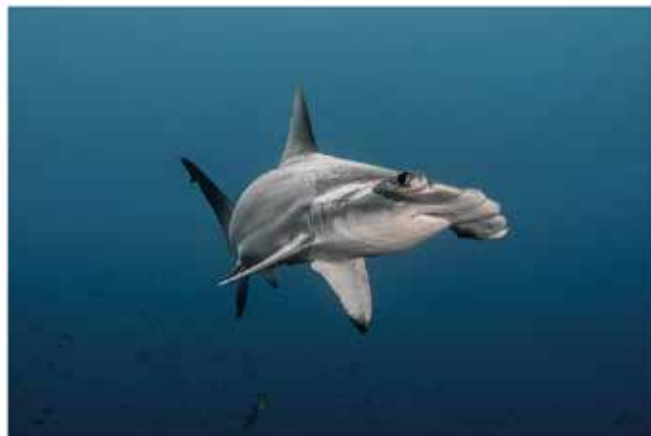
Wolf Island, Galapagos - Junio 2023