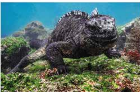
Fernandina Island, Galapagos - Julio 2018