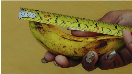
Transición (2023) Anita Lors - Cuba @anita.lors