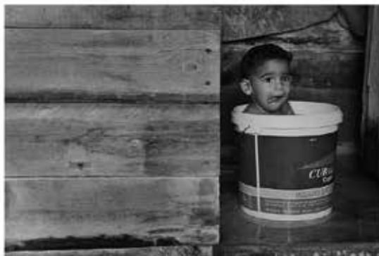
Dulce Infancia Didier Cruz Fernández - Cuba @didiercruz_fotografia