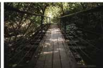
Camina sobre el tiempo (2023)

Tucumán definitivamente tiene historia, tanta que caminando senderos del cerro San Javier se pueden encontrar vías y puentes de incontables años, abrazados por la naturaleza totalmente verde. Hacia el Norte se encuentra Tafi del Valle, donde las rutas cuentan aún más historias, entre caminos áridos de ripio y tierra cruzar llamas se vuelve normal. ¿Quién es ahora el animal?