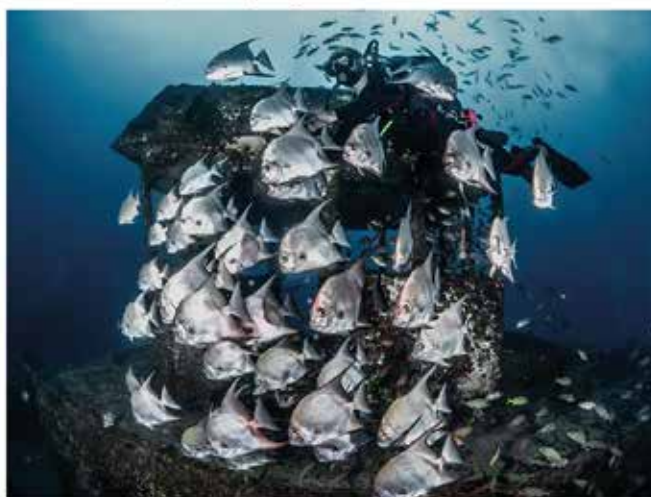
Recife - Enero 2021