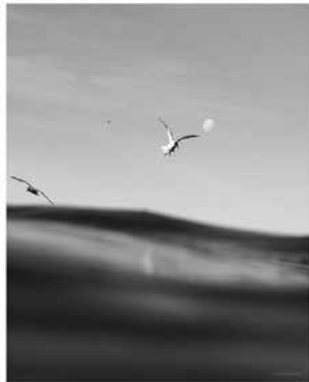
Perspectiva de Mar (2023) Catalina Hotz - Chile @catalinahotz

Las olas y de la belleza de los ecosistemas marinos en los que cohabitamos, inspirada en la visualización y valoración de este patrimonio natural.