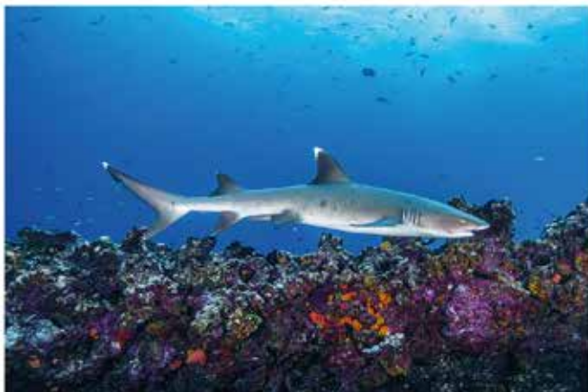
Cousin's Rock, Galapagos - Julio 2023