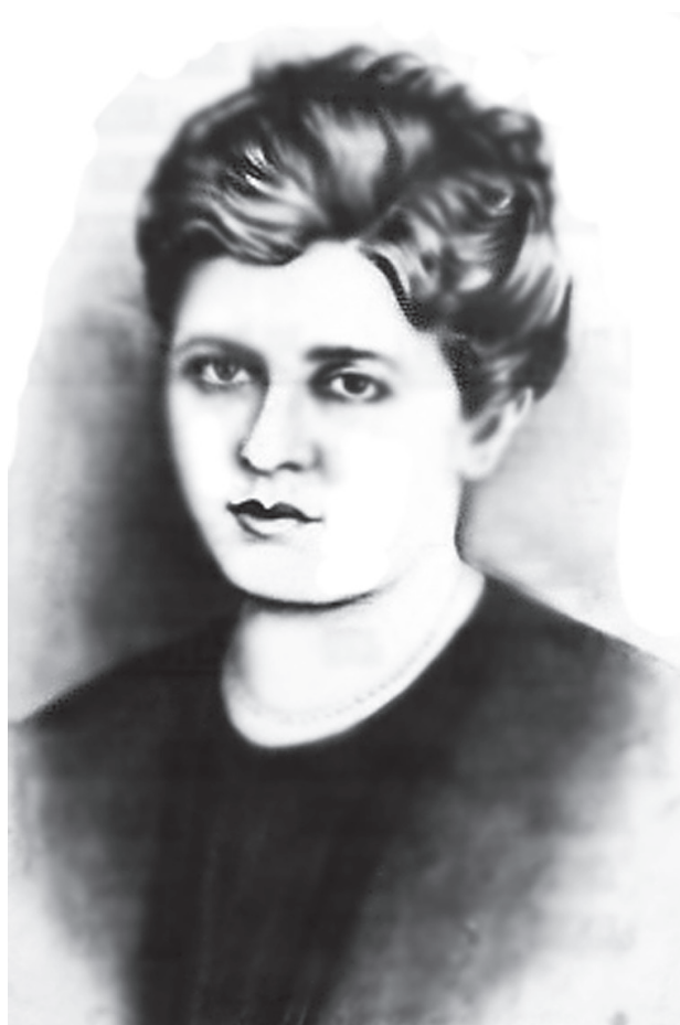
Kujtime nga ceremonia e diplomimit në Robert College, Stamboll, ku i pranishëm ishte Naim Frashëri