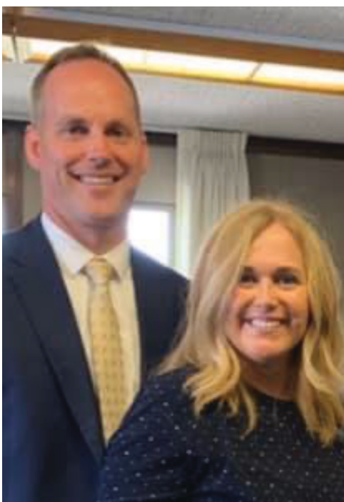
El hermano Dixon con su esposa en la actualidad

pastor era mi mejor amigo y un día me contó que su hermano mayor había traído una biblia repugnante proveniente de una iglesia mala. Una tarde, estaba yo con mi amigo en la iglesia del pastor cuando desde el púlpito el pastor habló sobre la iglesia mormona e incluso le mostró a la gente la portada del libro. Después de la reunión, pregunté al pastor: "¿Has leído ese libro?" y cómo él sabía que el Libro de Mormón era dañino. Más tarde, le pregunté a mi amigo si podía pedir prestado el libro para su estudio y me lo entregó el día siguiente. Cuando vi el libro y su título "Otro testamento de Jesucristo", escuché el susurro del Espíritu Santo en mi corazón diciéndome que este es un libro muy especial invitándome a leerlo. Durante los siguientes dos meses, estuve tratando de averiguar el propósito de este libro. Tenía muchas preguntas en mi cabeza, pero no conocía a nadie que las pudiera responder excepto el Espíritu Santo. Comenzaba a investigar haciendo una oración y un día, mientras oraba, comprendí el propósito del libro y se me reveló que el libro era verdadero. Descubrí que es un poderoso testigo de Jesucristo. [...] Un par de meses después me reuní con el pastor y le pregunté dónde podía encontrar a los mormones y le expliqué sobre la revelación de Jesucristo y le conté que este libro habla sobre Jesucristo. Al pastor no le gustó mi interés y me pidió que se lo devolviera. Antes, anoté la dirección postal y el nombre de la persona escrita en la parte posterior del libro».