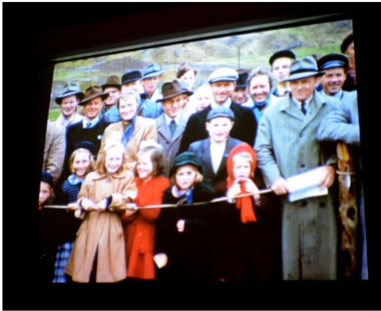
Verda på fram: Etterkvart innhenta fornufta hestemiljøet, og alle lag av samfunnet vart inviterte inn. I dag er det dei unge jentene som dominerer fjordhestmiljøet.