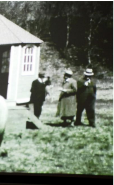
Ikke lov for kvinner og born å delta tidlegaste filmmaterialet bestod