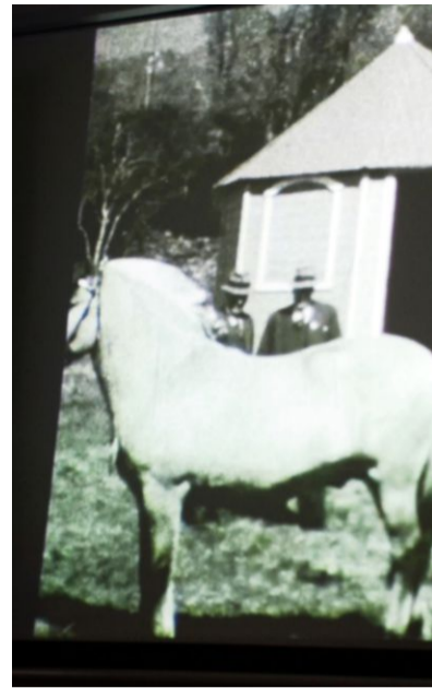
Eldre menn med hatt: Det var lenge på hingsetutstillingane. Mykje av det difor av stort sett godt vaksne karar.