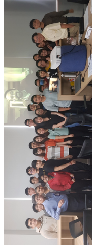
Hội Thảo về Phát Triển Nghề Nghiệp, Đại Học QT Bình Dương