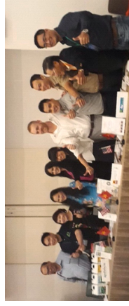
Giới Thiệu Sản Phẩm Nông Nghiệp CNC tại Hội Nghị Hợp Tác Việt Mỹ, TP HCM