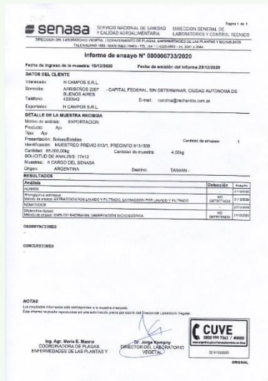
白色大蒜未罹刺足根蟻檢疫證明