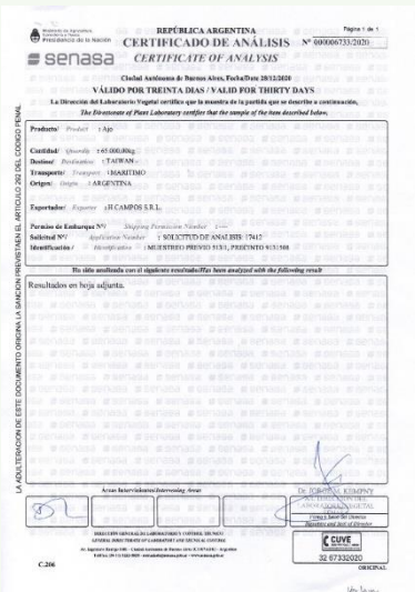
白色大蒜未罹染莖線蟲檢疫證明

產品名稱： 紅皮大蒜 / Red garlic 產品描述： 呈現出強烈的紅色外皮保護蒜瓣 產品收成： 每年 12 月收成 產品優勢： 最優質品種，飽滿圓潤，具有比其他品種更強的風味，並且可以保存更長的時間。 產品認證： 未罹染莖線蟲(Ditylenchus dipsaci(Kuhn) Filipjev) 未罹刺足根蟻(Rhizoglyphus echinopus Fumouze and Robin)