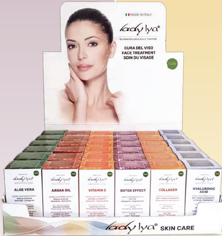
espositore da banco counter display présentoir de comptoir