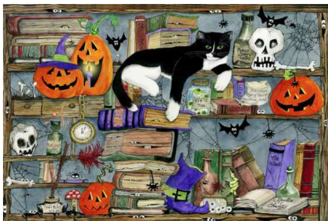
VC1044 Maison d'halloween 11,25 $