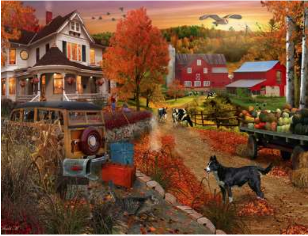
VC1149 Maison à la campagne 14,50 $