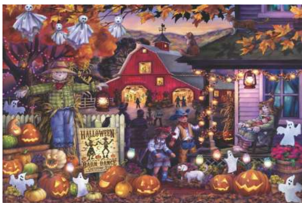
VC1238 Danse pour halloween 11,25 $