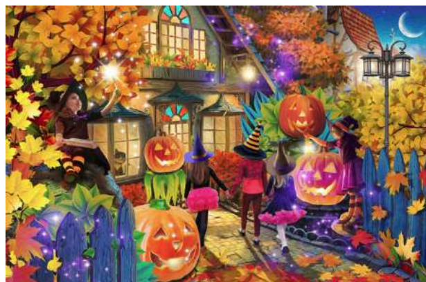
vc1132 l'heure des bonbons 11,25 $