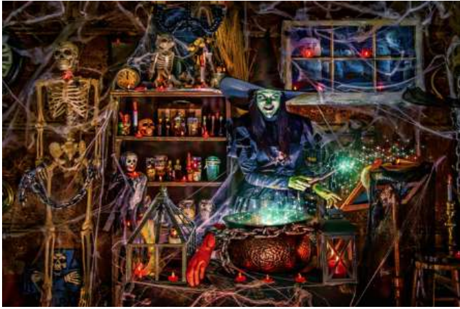
VC1069 Potion magique 14,50 $