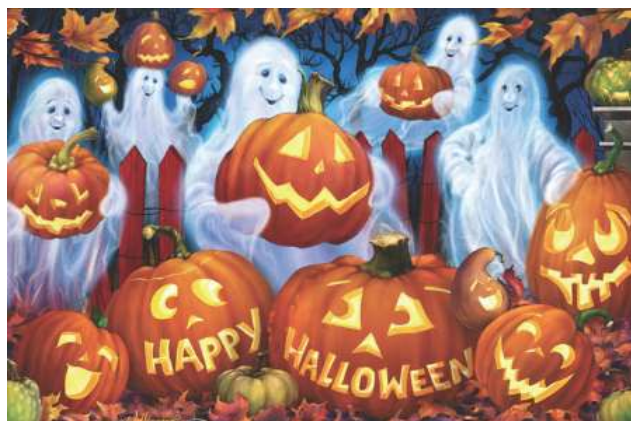
VC1129 Joyeux halloween 11,25 $