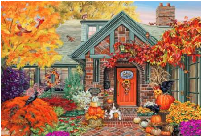
VC1204 Bienvenue automne 14,50 $