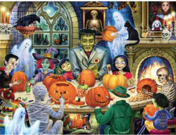
VC1128 Soirée épouvante 14,50 $