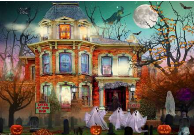
VC1252 Soirée d'épouvante 14,50 $