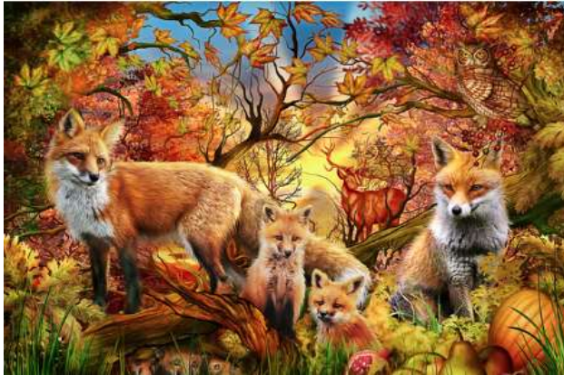
VC1182 Renards d'automne 13,50 $