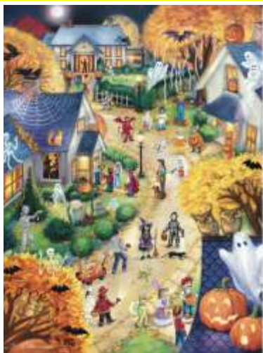
VC174 Le village d'halloween 13,50 $