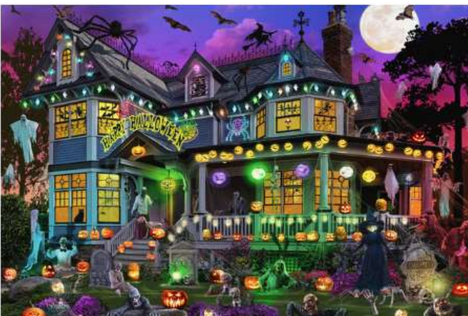
VC1148 Maison d'halloween 13,50 $