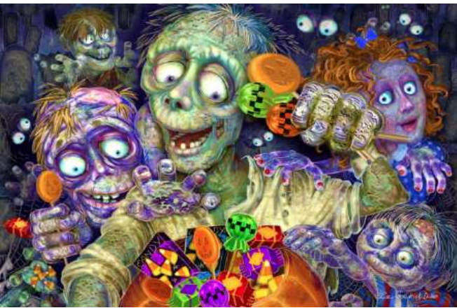
VC1155 Zombie aime les bonbons 14,50 $