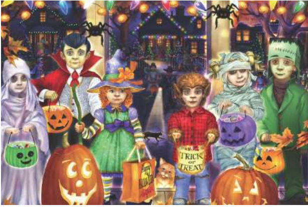
VC1236 Nuit d'halloween 13,50 $