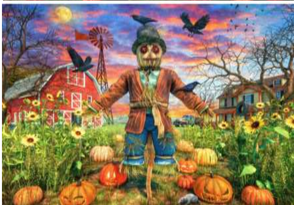
VC1272 Épouvantail 13,50 $