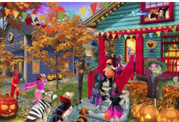
VC1234 La cueillette des bonbons 14,50 $