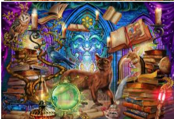
VC1270 Mystère 13,50 $