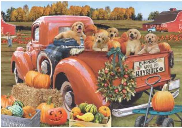
VC1277 Camion des amis pour Halloween 14,50 $