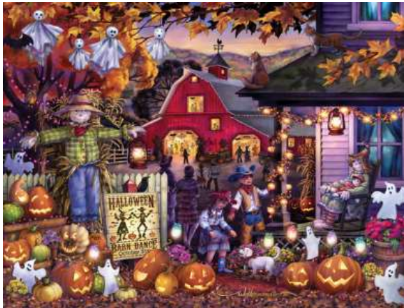
VC1040 La danse d'halloween 14,50 $