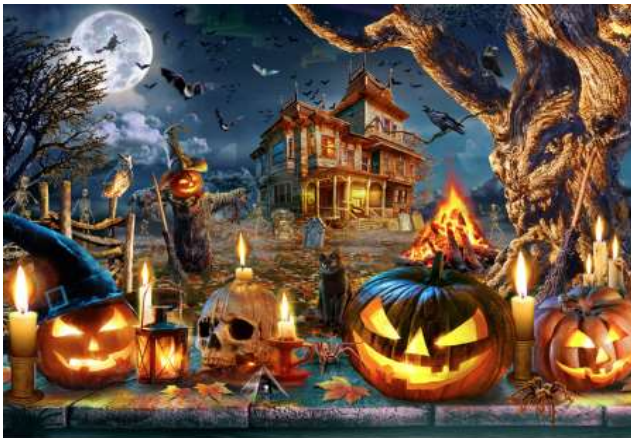
VC1269 Les citrouilles lumineuses 14,50 $