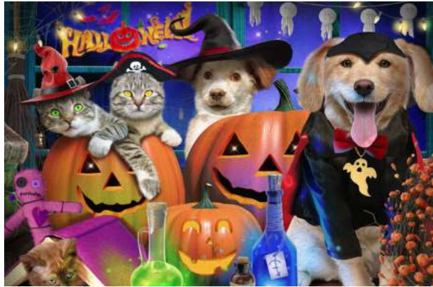
VC1235 Chiens à l'halloween 13,50 $