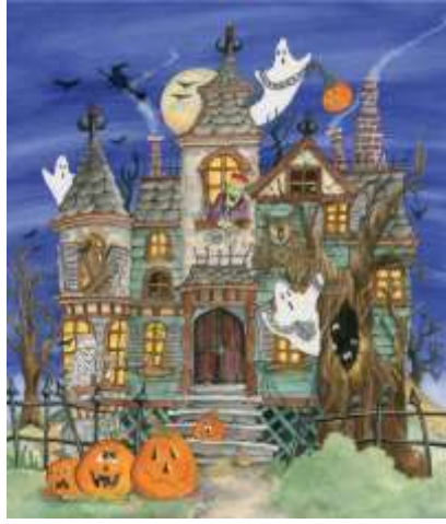
VC105 Maison hantée 14,50 $