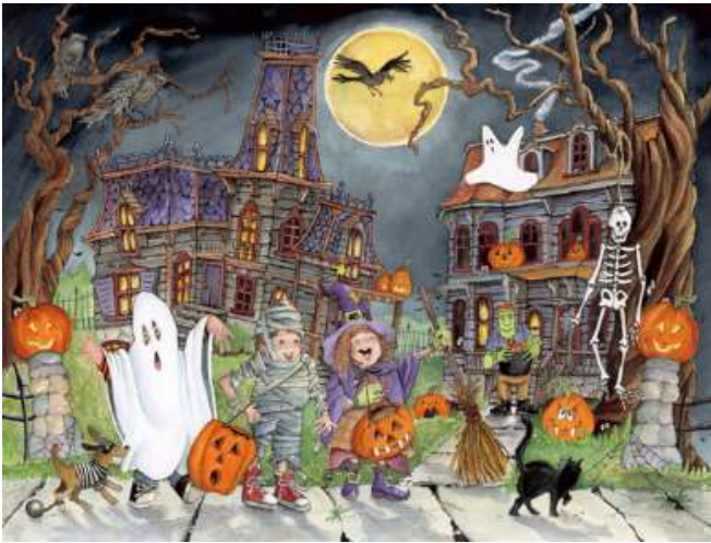
VC119 La nuit d'Halloween 14,50 $