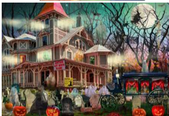
VC1273 Maison hantée 13,50 $