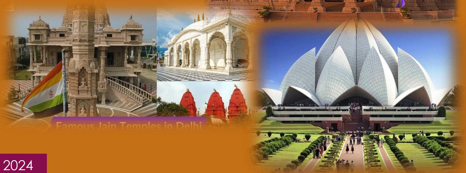
Famous Jain Temples in Delhi