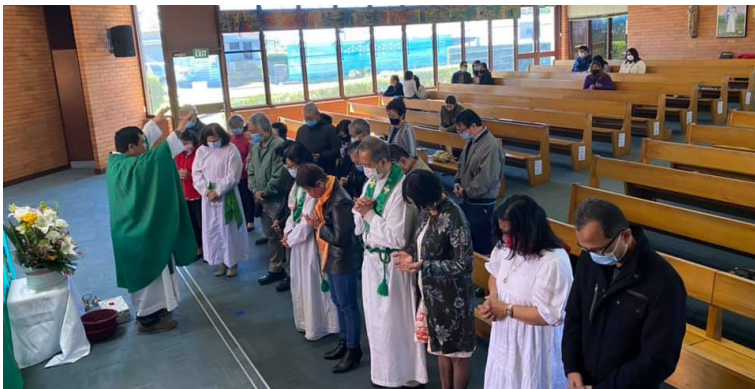
Misa @ St. Ita, 25 Juli