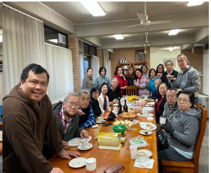
Celebrating World Day for Grandparents and the Elderly, 26 Juli