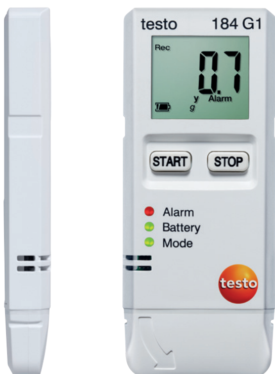
Figura a tamaño original

Todas las ventajas de los registradores de datos testo 184 de manera resumida.