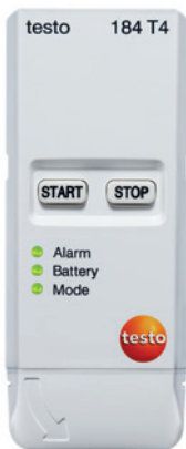
testo 184 T4