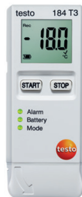
testo 184 T3