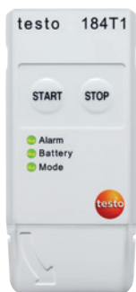
testo 184 T1

Resumen de los registradores de datos testo 184 .