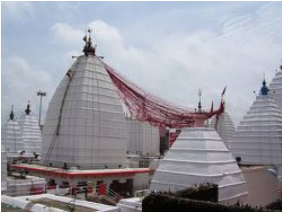
Deoghar, stato del Bihar: Baba Baidyanath Temple joty lingham