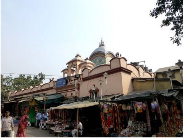
Calcutta, stato del West Bengala: tempio di Kalighat Kali (shakti peeth, dita piede destro)