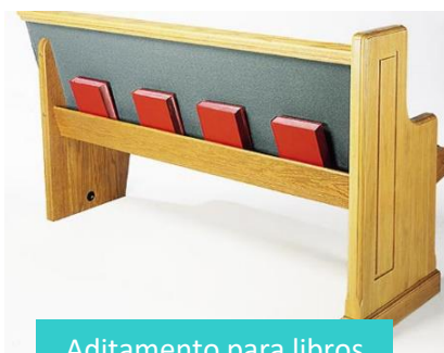
Aditamento para libros

Opcionalmente con costo adicional usted puede elegir la instalación de portabiblias en el respaldo de la banca. También fabricado en madera de pino de primera estufado. Aditamento para libros o biblias en el respaldo de la banca para iglesia