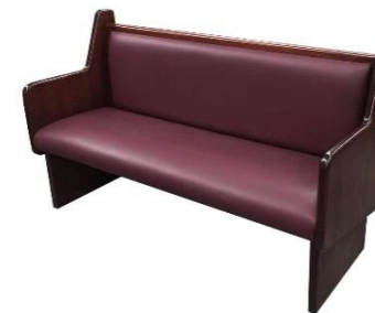
Banca para Iglesia MOD:2

Bancas económicas para iglesia fabricadas en acero y madera con reclinable retráctil, ideal para ahorrar amueblando tu iglesia. Estas prácticas bancas para iglesia cuentan con un diseño armonioso y muy resistentes al uso rudo. Reclinador retráctil de acero con madera de pino de primera estufado y barnizado a la elección del cliente de nuestro catálogo