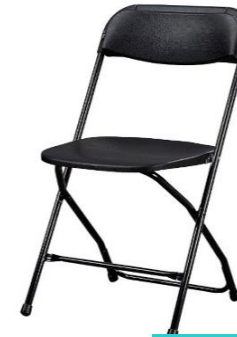
Silla Plegable Polipropileno

Estructura: tubo metálico mate con tapas de madera con espuma de alta densidad, tapizadas con tela tipo pliana" en su asiento y respaldo, con tapones de hule