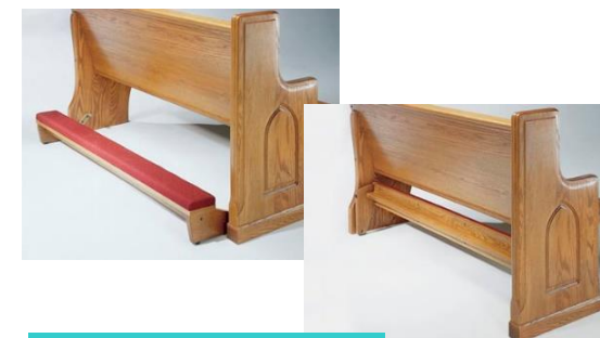
Aditamento posa pie

Opcionalmente con costo adicional usted puede elegir la instalación de portabiblias en el respaldo de la banca. También fabricado en madera de pino de primera estufado. Aditamento para libros o biblias en el respaldo de la banca para iglesia