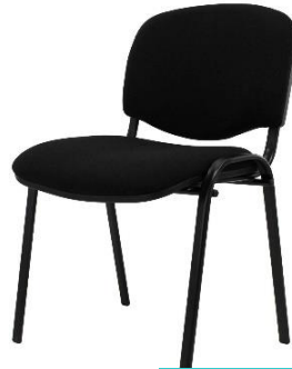
Silla Fija para Iglecia MOD:2

Estructura: tubo metálico mate con tapas de madera con espuma de alta densidad, tapizadas con tela tipo pliana" en su asiento y respaldo, con tapones de hule