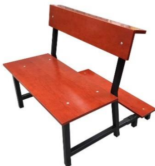
Banca para Iglesia MOD:1

Bancas económicas para iglesia fabricadas en acero y madera con reclinable retráctil, ideal para ahorrar amueblando tu iglesia. Estas prácticas bancas para iglesia cuentan con un diseño armonioso y muy resistentes al uso rudo. Reclinador retráctil de acero con madera de pino de primera estufado y barnizado a la elección del cliente de nuestro catálogo