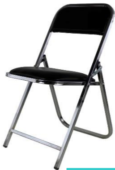
Silla Plegable Acojinada

Silla Plegable Polipropileno para eventos. Estructura: tubular metálico cuadrado cromado 3/4" con espuma de alta densidad, tapizadas con tela tipo "tacto piel" en su asiento y respaldo, con tapones de hule