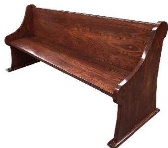
Banca para Iglesia MOD:3

Bancas para iglesias económicas de madera tapizadas para mayor comodidad. Usted puede elegir el color y el modelo de descanso de brazos. Hermosa y resistente banca de madera de pino de primera estufado al color de su elección y tapizada en telas disponibles de nuestro catálogo. Alta durabilidad