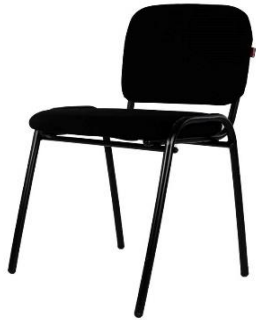
Silla Fija para Iglecia

Estructura: tubo metálico mate con tapas de madera con espuma de alta densidad, tapizadas con tela tipo pliana" en su asiento y respaldo, con tapones de hule