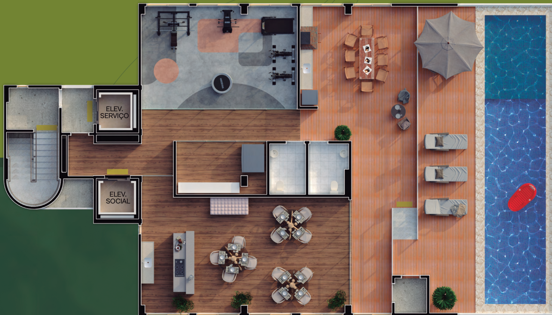
Planta baixa pavimento cobertura/lazer