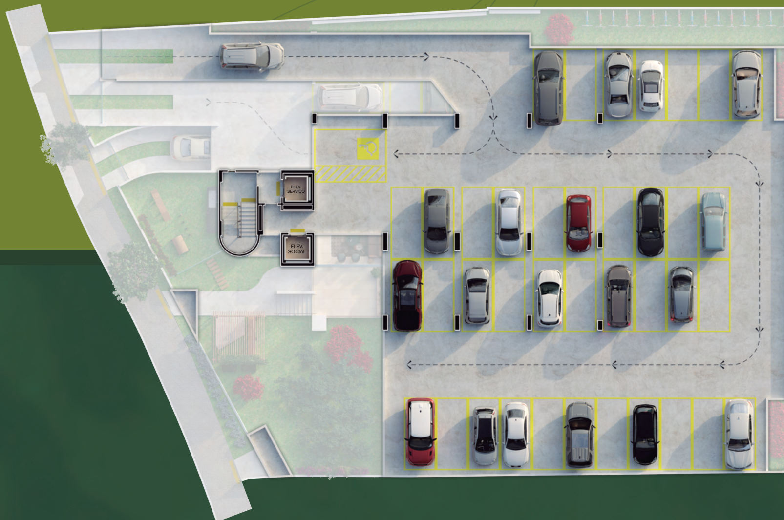
Planta baixa pavimento vazado