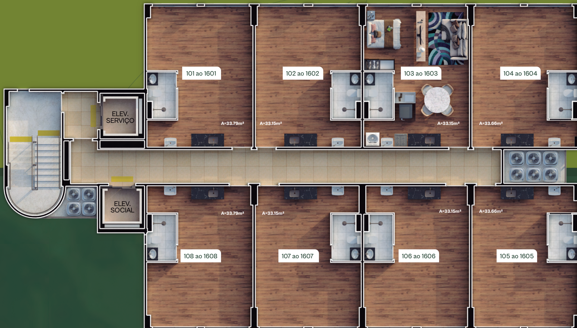
Planta baixa pavimento tipo