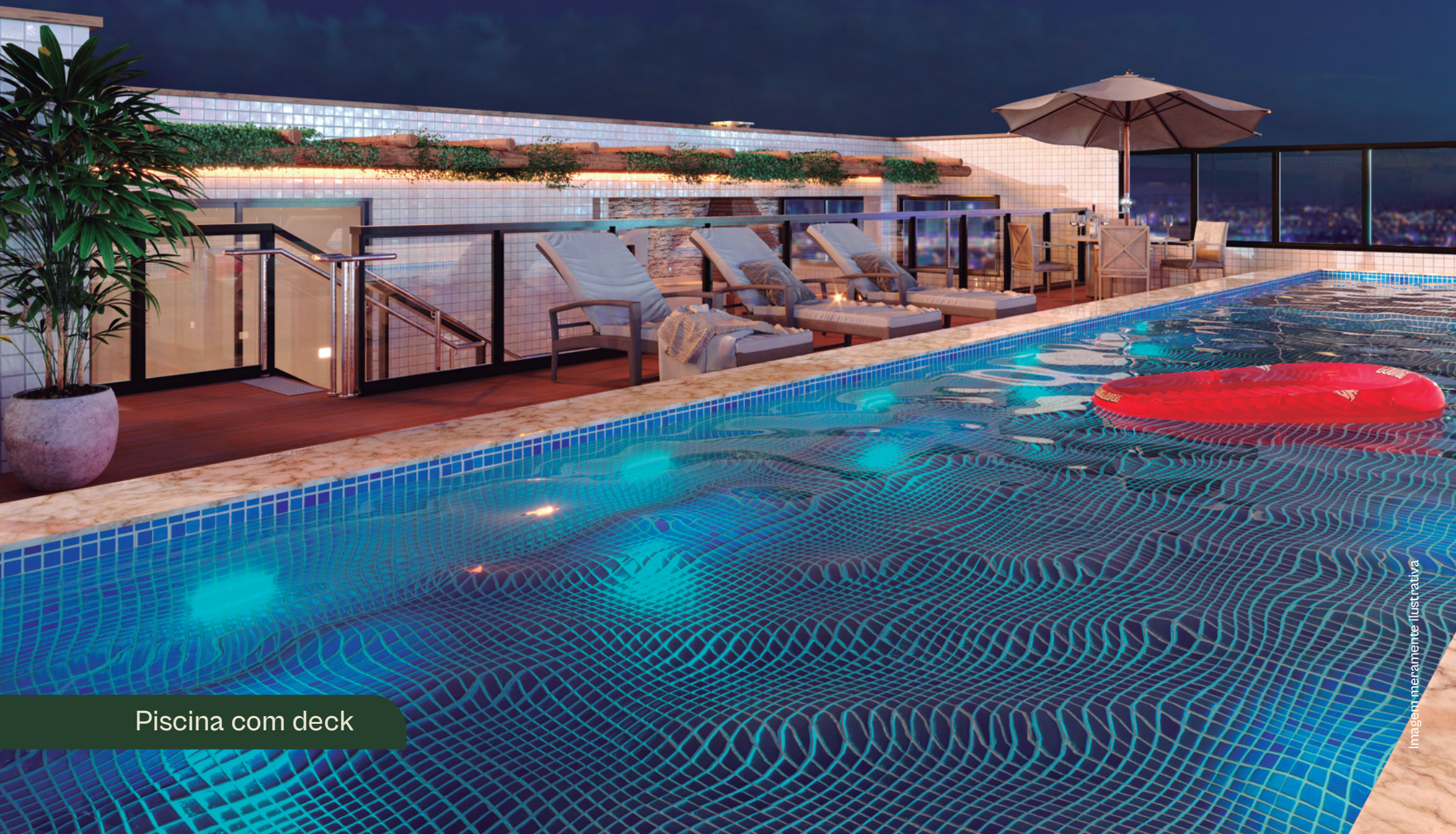
Piscina com deck