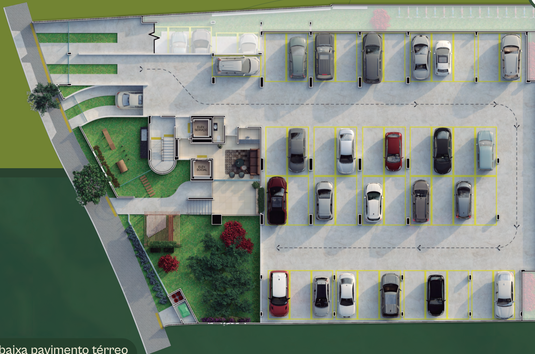
Planta baixa pavimento térreo