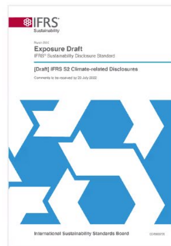
NIIF S2: Divulgación Climática