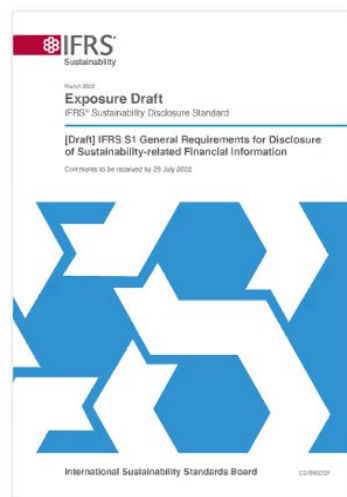
NIIF S1: Requerimientos Generales