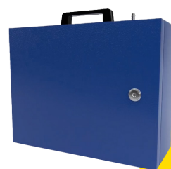
Sense Max E108104