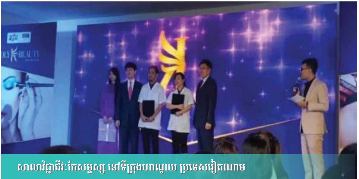
សាលារិក្ខាជីវៈកែសម្រួល នៅទីក្រុងហាណូយ ប្រទេសវៀតណាម