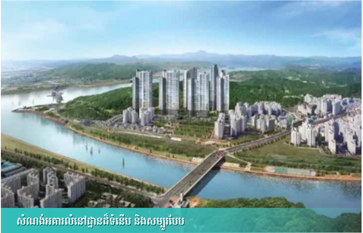
សំណង់អគារលំនៅដ្ឋានដ៏ទំនើប និងសម្បូរបែប