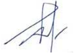
លោក CHEON GIL PARK អគ្គនាយក