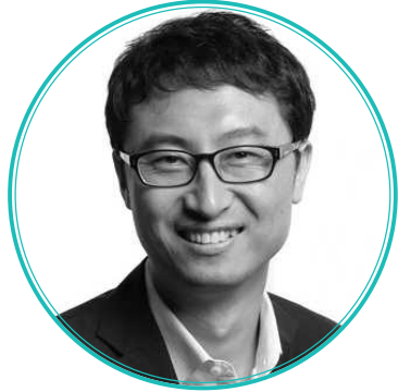
លោក CHEON GIL PARK អភិបាល និងអគ្គនាយកប្រតិបត្តិ