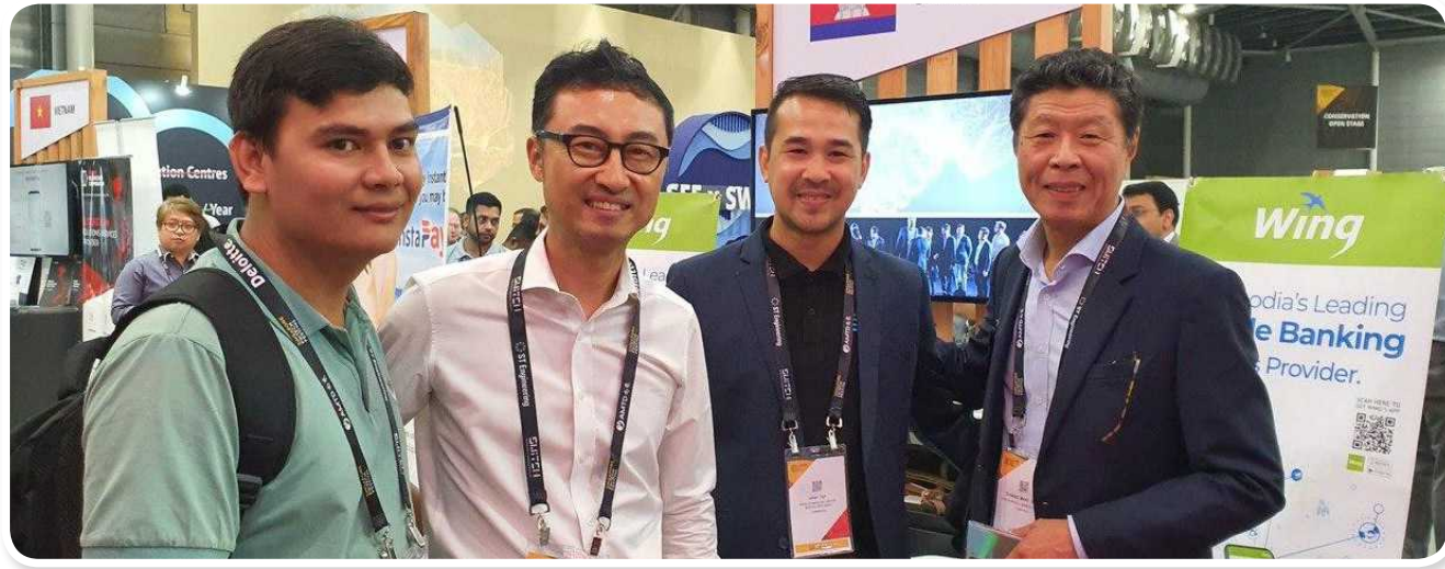
ដំណើរទស្សនកិច្ចថ្នាក់ដឹកនាំនៅទីក្រុងសេអ៊ូល (ឧសភា)