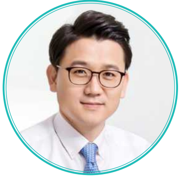
លោក MOON KYU CHOI ប្រធានក្រុមប្រឹក្សាភិបាល