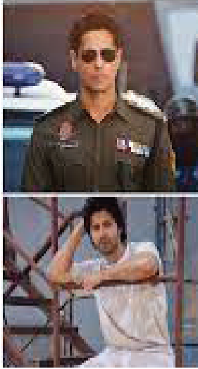
सुजाय घोष की निर्माणाधीन फिल्म से ओटीटी डेब्यू कर रही

रोहित का भी यह ओटीटी डेब्यू कहा जाएगा। सीरीज में शिल्पा शेठ्टी और विवेक ओबेरॉय भी अहम किरदारों में नजर आएंगे। सीरीज प्राइम वीडियो पर रिलीज होगी। वरुण राज एंड डीके निर्देशित वेब सीरीज से डेब्यू करेंगे, जो अमेरिकन सीरीज सिटेल का रीमेक है। इस सीरीज में वरुण सामंथा रूथ प्रभु के साथ नजर आएंगे। इरफान खान के बेटे बाबिल काला से ओटीटी पर अपनी पारी शुरू कर रहे हैं। बाबिल की यह एक्टिंग करियर की शुरुआत भी है। नेटफ्लिक्स पर आ रही फिल्म में तृप्ति डिमरी और स्वास्तिका मुखर्जी भी लीड स्टार कास्ट में शामिल हैं। करीना