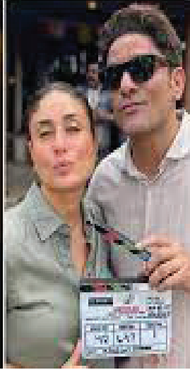
साथ स्क्रीन स्पेस शेयर कर रहे हैं। इसकी कहानी थ्रिलर नॉवल

द डिवोशन ऑफ सस्पेक्ट एक्स से ली गयी है। हाल ही में करीना ने फिल्म की शूटिंग पूरी की है। सारा प्राइम वीडियो की वेब सीरीज ए वतन मेरे वतन से ओटीटी डेब्यू कर रही हैं। वरुण ने इसका हिंट एक वीडियो के जरिए दिया था, जो प्राइम वीडियो के सोशल मीडिया एकाउंट्स से शेयर किया गया था। इसका निर्माण करण जौहर कर रहे हैं और इसकी पृष्ठभूमि 1942 का भारत छोड़ो आंदोलन है। सारा, स्वतंत्रता संग्राम सेनानी के मुख्य किरदार में होंगी। शाहिद राज एंड डीके निर्देशित वेब सीरीज से ओटीटी पारी शुरू कर रहे हैं।