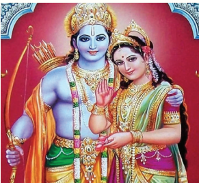
सीता नवमी हर साल

वैशाख मास के शुक्ल पक्ष की नवमी को मनाई जाती है। धर्म ग्रंथों के अनुसार इसी दिन सीता का प्राकट्य हुआ था। इस पर्व को ह्यजानकी नवमी भी कहते हैं। इस बार यह त्योहार 10 मई को मनाया जा रहा है। सीता