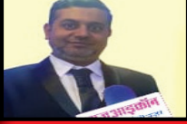
संपादक - गुर्तेजा मामाजीवाला