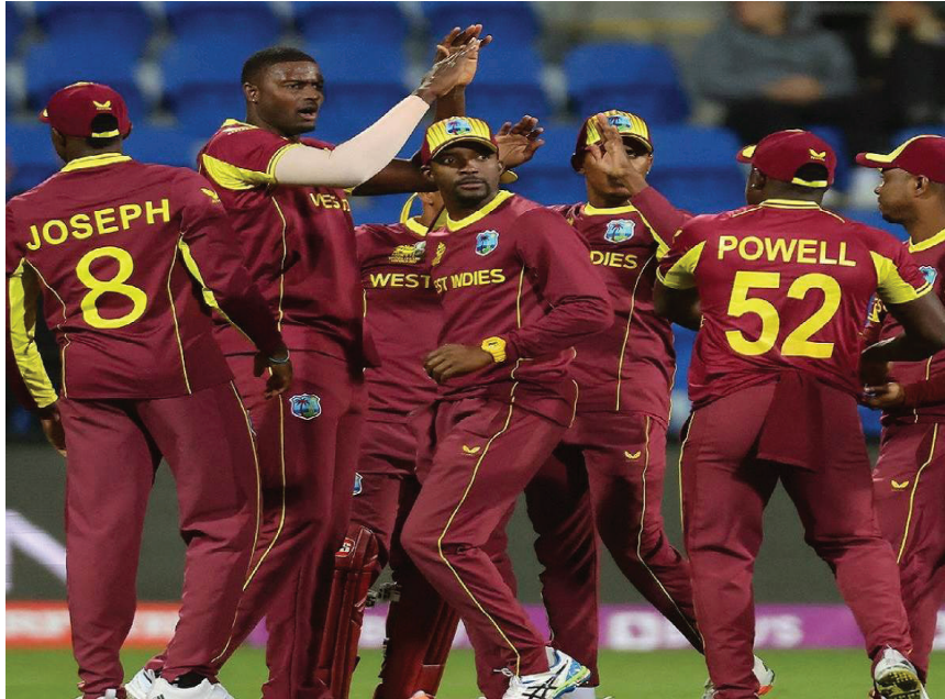
जिंबाब्वे के साथ 0.759 के सर्वश्रेष्ठ एनआरआर के साथ तालिका में शीर्ष पर है।

नई दिल्ली। दो बार की पूर्व चैंपियन वेस्टइंडीज की भिड़ंत आयरलैंड से और स्काटलैंड का सामना आइसीसी टी-20 विश्व कप में शुक्रवार को जिंबाब्वे से होगा जिसमें ग्रुप-बी की शीर्ष की दो टीमों को सुपर-12 के लिए क्वालीफाई करने का मौका मिलेगा। समाचार एजेंसी आइएनएस के मुताबिक, वेस्टइंडीज, आयरलैंड, स्काटलैंड और जिंबाब्वे के बीच जो भी दो टीमों अपने मैच जीतती हैं, वे आगे बढ़ जाएंगी, लेकिन होबार्ट में शुक्रवार को वर्षा की संभावना है और ऐसे में समीकरण नेट रन रेट पर निर्भर हो जाएगा। वर्तमान में, स्काटलैंड दूसरे स्थान पर