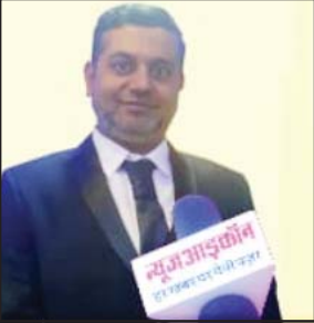
संपादक: मुर्तजा मामाजीवाला

वेब सीरीज तांडव के निर्देशक और इसकी पूरी टीम ने उन दर्शकों से माफी मांग ली है, जिनकी भावनाएं इसके कुछ दृश्यों से आहत हुई हैं। आरोप है, इसमें हिंदू देवताओं का उपहास उड़ाया गया है। बहरहाल, इस माफी के बाद अब विवाद का पटाक्षेप हो