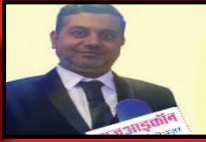
संपादक - मर्तुजा मामाजीवाला