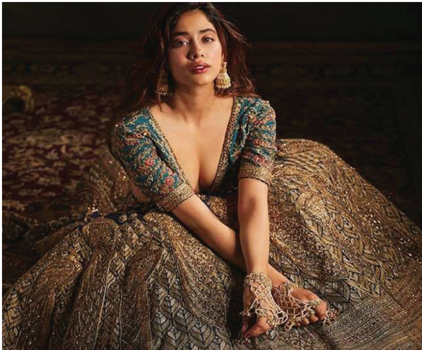
बॉलीवुड फिल्म मेकर करण जौहर के 50वें जन्मदिन के मोके पर पूरा इंडस्ट्री के खूबसूरत

सितारों का जलवा देखने को मिला। सलमान खान, रणबीर कपूर, ऋतिक रोशन, कियारा आडवाणी, आयुष्मान खुराना, कटरीना कैफ, विकी कौशल समेत बॉलीवुड के कई सितारों ने शिरकत की। इस मौके पर हर किसी ने अपने ड्रेसिंग सेंस के जरिए फैस और पैपराजी का ध्यान अपनी ओर खींचने की पूरी कोशिश की। करण जौहर की इस पार्टी की कई तस्वीरें और वीडियोज सोशल मीडिया पर लगातार वायरल हो रहे हैं।