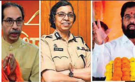
के डीजीपी हैं। रश्मि शुक्ला का जून 2024 में रिटायरमेंट होना

जा सकता है। रश्मि शुक्ला 1988 बैच की आईपीएस अधिकारी हैं, जो फिलहाल सीआरपीएफ की एडीजी के तौर पर हैदराबाद में हैं। डीजी हेमंत नगराले के बाद वह महाराष्ट्र की सबसे सीनियर आईपीएस अधिकारी हैं। हेमंत नगराले 31 अक्टूबर को रिटायर हो रहे हैं। इसके अलावा आईपीएस अधिकारी रजनीश सेठ से भी रश्मि शुक्ला सीनियर हैं, जो फिलहाल महाराष्ट्र