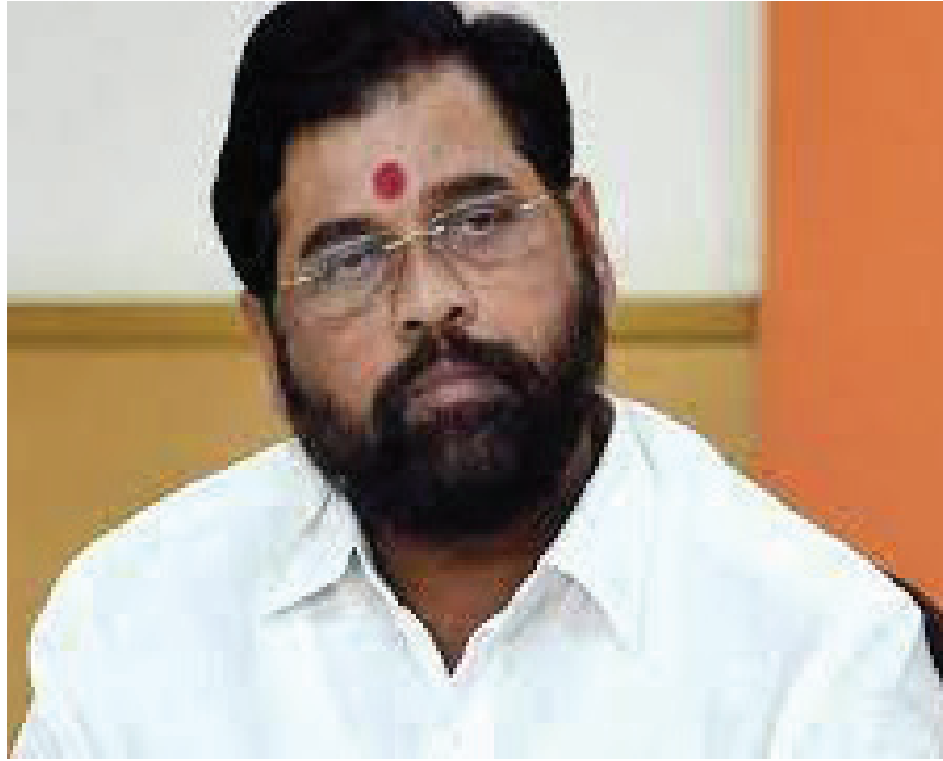
विकास के मुद्दे पर शिंदे के साथ जुड़े थे और यह सवाल उठाकर कि हमने जुड़ने के लिए रुपये

8 अन्य विधायकों के साथ फैसला ले लेंगे। उन्होंने कहा, ह्यवह यह दावा करते हुए निजी हमले कर रहे हैं कि मैंने रुपये लिए और गुवाहाटी गया। केवल मैं ही नहीं था, जो गुवाहाटी गया था, 50 और विधायक थे। इस मुद्दे पर शिंदे और फडणवीस को संज्ञान लेना चाहिए, क्योंकि अगर आपका समर्थन करने पर आपके ही समर्थक विधायक की तरफ से ऐसे सवाल उठ रहे हैं, तो यह दुर्भाग्यपूर्ण है। कडू ने दावा किया है कि इसके जरिए उनकी ही नहीं, बल्कि शिंदे और फडणवीस की छवि खराब की जा रही है। उन्होंने कहा, ह्यकेवल मेरी छवि खराब नहीं हो रही है, लोग पूछेंगे कि सीएम और डिप्टी सीएम ने मुझे कितने रुपये दिए। 50 विधायक