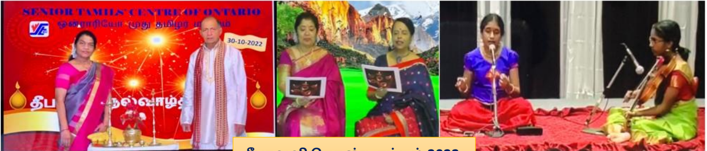
தீபாவளி கொண்டாட்டம் 2022