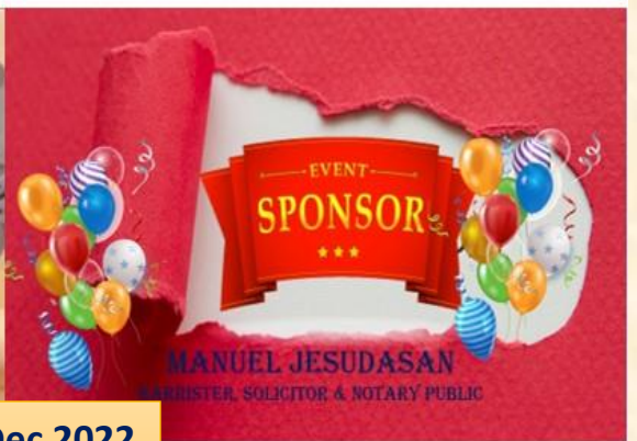
Christmas Celebrations –Dec 2022