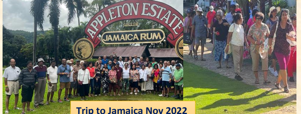
Trip to Jamaica Nov 2022