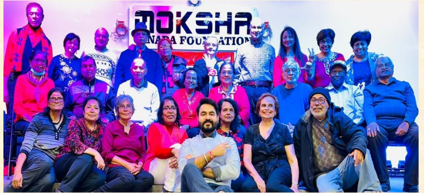
Monday Program at Moksha Canada Foundation Navaratri Celebrations 2022