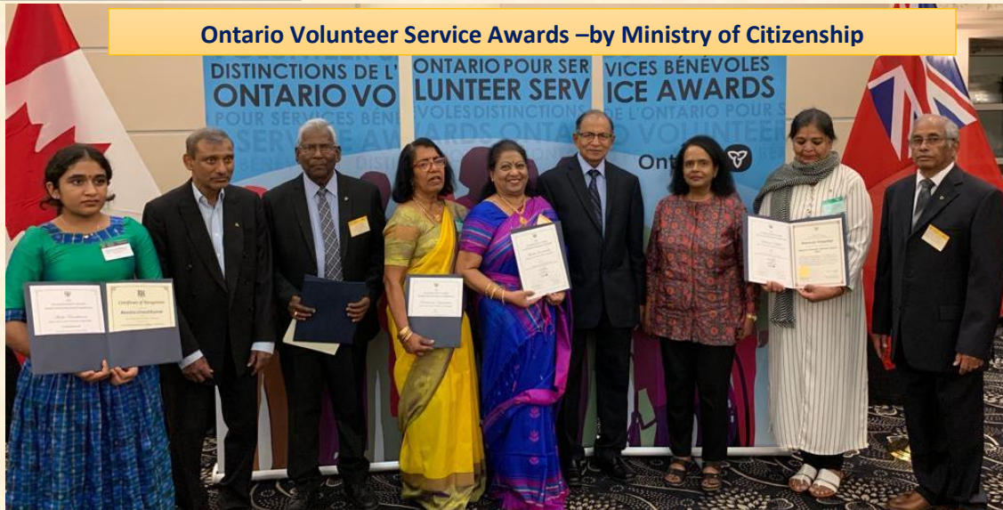
Ontario Volunteer Service Awards –by Ministry of Citizenship