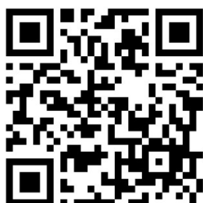
Imagen 3: Modelo de QR encuesta para todo público

Nota: esta debe ser adaptada a los síntomas que se quieran identificar.