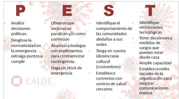
Imagen 1: Análisis PEST propuesto.

Realiza un análisis PEST 3 aplicado a la situación de su organización