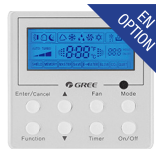
Thermostat filaire (XE-71)