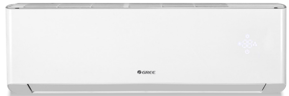
Unité murale Extreme