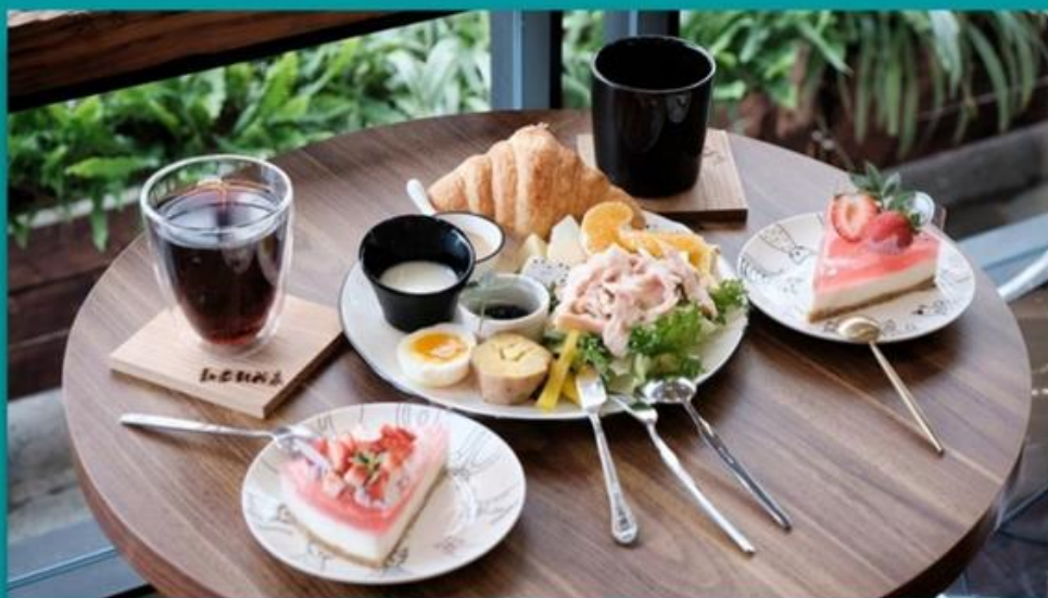
愛心合作廠商中壢【散步到我家早午餐廳】