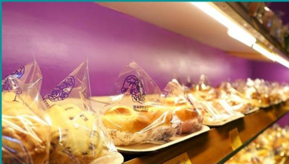
愛心合作廠商竹東【維納斯烘焙坊】