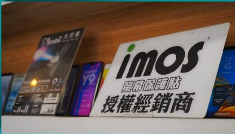
愛心合作廠商竹東【手機屋】