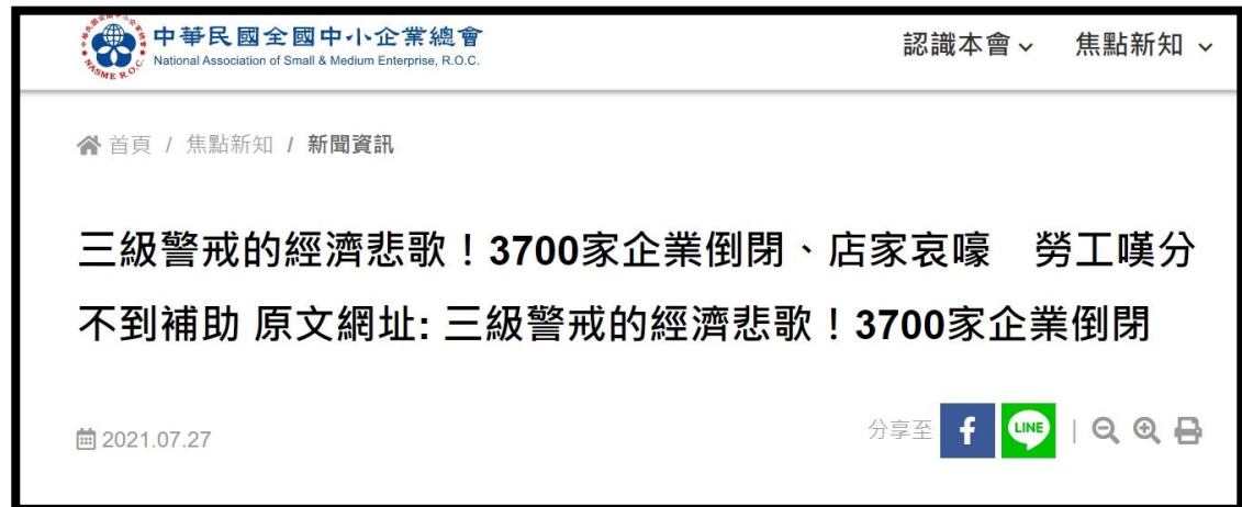
圖 5：中華民國全國中小企業總會