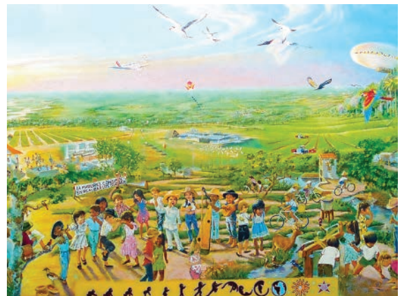
Mural sobre el todo de Gaviotas ubicado en su Aula Múltiple.

Dialogando en Gaviotas siempre estamos en la búsqueda permanente de verdades temporales sin olvidar que no hay nada más productivo que la humildad.