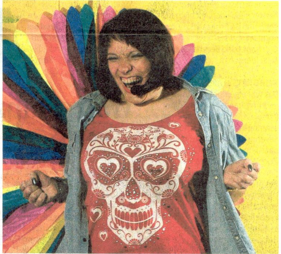
Die Dialoge der Flirtschule waren zum Brüllen komisch.