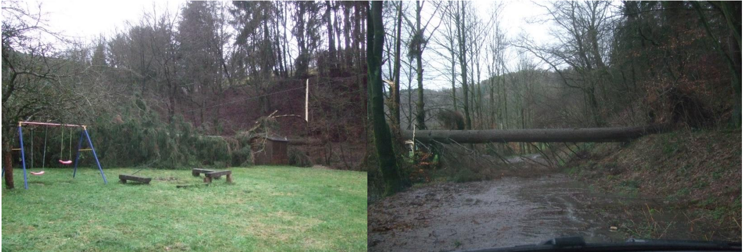
Donnerstags kamen schon die Reparatur-Monteur der Agger-Energie mit Bagger und Hubfahrzeug

Am Mittwoch, den 3. Januar 2018, fegte der Wintersturm "Burglinde" mit Orkanböen, Regen und Hagel über uns hinweg. Als wir alle glaubten das schlimmste sei überstanden, gingen gegen 9.30 Uhr plötzlich alle Lichter aus. Eine mächtige Tanne am Bachweg gegenüber Haus Nr. 5 der Korseifener Straße hatte im aufgeweichten Boden keinen Halt mehr und war auf die Hochspannungsleitung gestürzt. Zwei Kabel waren vollständig zerrissen, ein drittes Kabel hing unter dem Baum fest und war zum Zerreißen gespannt. Bald kamen Inspekteure der Aggerenergie, um den Schaden zu besichtigen. Um 12.20 Uhr war der Strom wieder da, nach weniger als 3 Stunden Ausfall. Wir erinnerten uns an Sturmtief "Kyrill", der am 18. Januar 2007 für 19 Stunden Stromausfall gesorgt hatte.