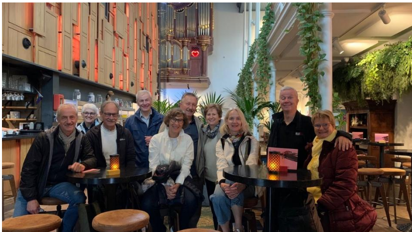
Mixed Riege in Utrecht

Kasernenstr. 12 · 4410 Liestal · T 061 927 95 00 www.brodbeckag.ch · info@brodbeckag.ch