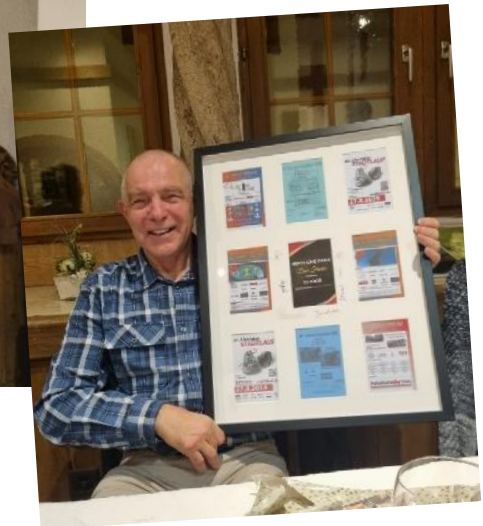
OK Liestaler Stadtlauf