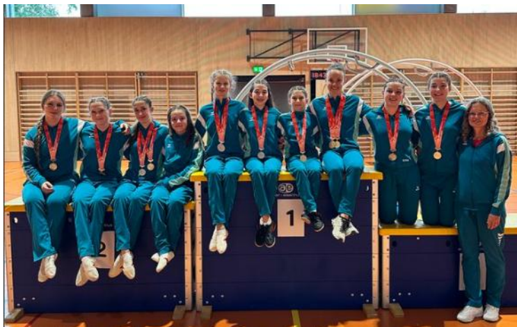
Die erfolgreichen Rhönradturnerinnen an der SM in Baar

Während für die meisten Athletinnen die Saison mit der SM ihren Höhepunkt und würdigen Abschluss gefunden hat, beginnt für die WM-Teilnehmerinnen die sehr intensive Vorbereitungsphase mit mehreren zusätzlichen Trainings im Nationalkader. Wir wünschen an dieser Stelle eine unfallfreie Vorbereitung und dann alles Wettkampfglück für eine erfolg- und erlebnisreiche Weltmeisterschaft. Toi, toi, toi!