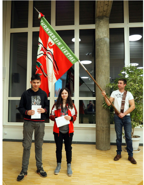
Neumitglieder aus dem Jahrgang 2003

für Teilzeitarbeit sei nach wie vor eher gering. Vor allem in einer Sportart wie Unihockey, wo man in der Schweiz auch als Natispieler noch einer Arbeit nachgehen muss. Auf die Frage, wieso die nordischen Länder so gut seien meinte er, dass in diesen Ländern die Bedingungen besser seien. Um 16:00 Uhr sei der Arbeitstag dort zu Ende und ab dann nutzt man die Zeit für den Sport. Unsere Unihockeyspieler wollten von Mendelin wissen, ob man in naher Zukunft damit rechnen könne, das Unihockey olympisch wird. Das sei eher schwierig, denn zum einen wollen auch andere Sportarten olympisch werden und zum andern sei Unihockey nicht auf der ganzen Welt verbreitet. Somit ging eine weitere, spannende Engeli Lounge zu Ende.