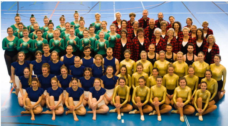
Black and White...colorful