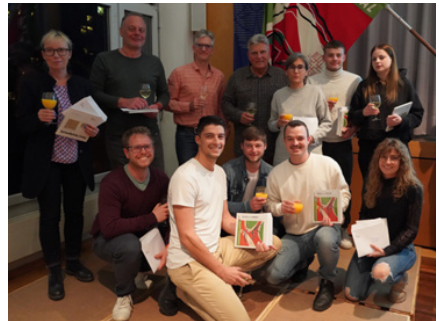
Zahlreiche Neumitglieder wurden willkommen geheissen