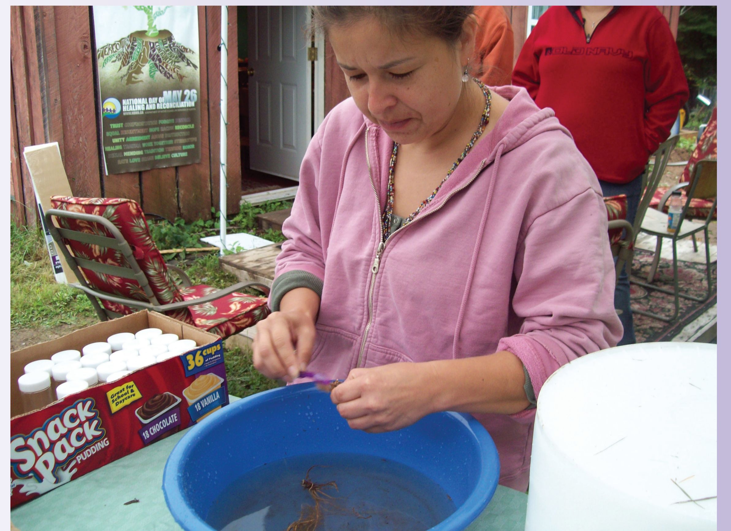
Making Valerian tincture. Faire de la teinture de Valériane.

Les Abénaquis connaissent plus de mille plantes à usage alimentaire, médicinal, pratique et cérémoniel. Cette connaissance leur a permis de réussir dans des milieux variés. Certains de ces aliments sont semblables à ceux consommés de nos jours : légumes racines et légumes verts, fruits, noix, baies, graines, champignons, sirop d’érable, riz sauvage et fruit sauvage font aujourd’hui le délice aussi bien des Autochtones que des non-Autochtones.