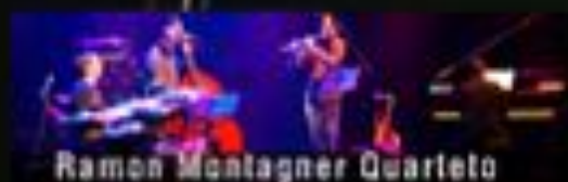
Ramon Montagner Quarteto

Agradecemos a todos que participaram, apoiaram e assistiram ao Batuka! Brasil 2010. Nos vemos em 2011!