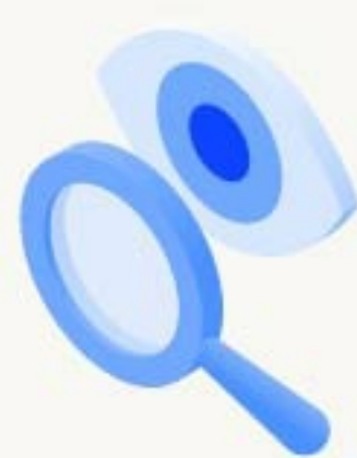
Capacidades de búsqueda incomparables