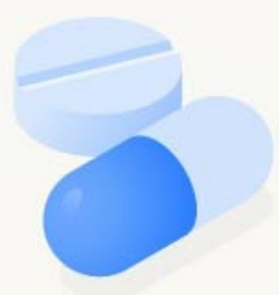
Documentos de la FDA y la EMA

Encuentre datos precisos, como ninguna otra herramienta