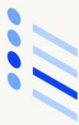
Evidencia del mundo real de FAERS