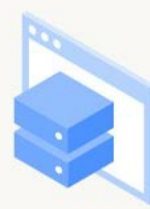
Datos legibles por máquina

“... PharmaPendium destaca en la recuperación de observaciones específicas de toxicidad a través de documentos de aprobación categorizados por fármaco y especie.”