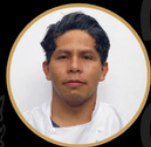
KIMNOR MABICA Cocina CCQS - 2028