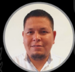
OSCAR BRAVO Alimentos & Bebidas OHB - 1019