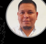
OSCAR BRAVO Alimentos & Bebidas OHB - 1019