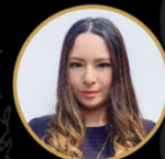
ITZUMI PLAZA Recepción CCQS - 2040